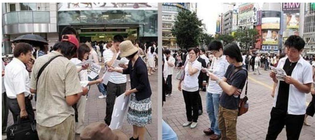
受け取ったチラシを熱心に読む街宣を聞いていた人々

まず、この四タイプのチラシを入れたボックス・パネルをご覧ください。日本VS民主党、うまい話には裏がある、日本の今を知らせたい、民主党の支持団体の四つのチラシが入っています。誰が考えたのか分かりませんが、良いアイデアですね。いろいろな街宣に参加してきましたが、はじめてみました。