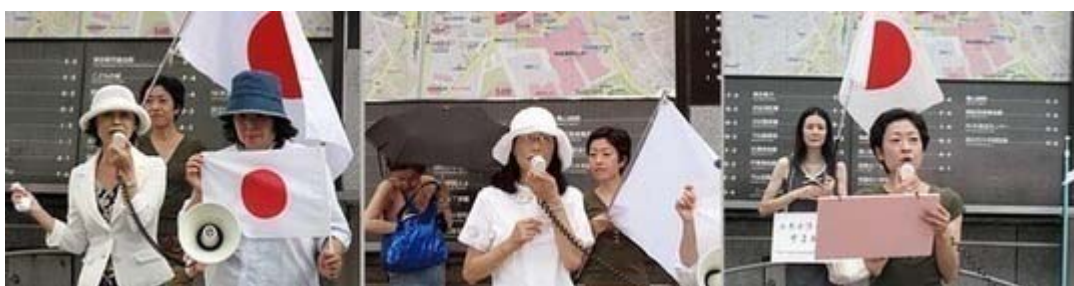
マイクを握ってハチ公前の人々に呼びかけるそよ風のメンバーの皆さん

民主党 の沖縄ビジョンの危険性を訴えるとき、大好きな沖縄が日本ではなくって中国のものになってしまう、という訴えかけは、上手い説明の仕方だと感じました。難しい政治の話ではなく、人気の観光スポットでもある沖縄が 中国 領？、ということで人々の足を止めるには十分な訴えでした。