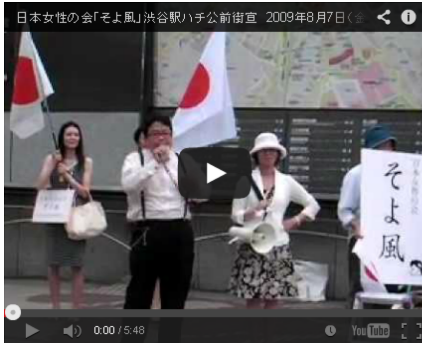
日本女性の会「そよ風」ホームページはこちら