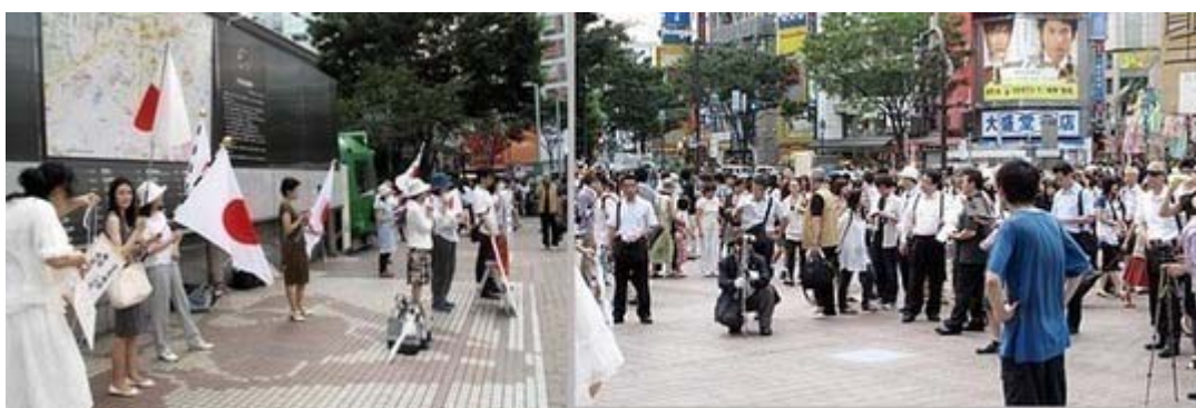
この女性陣が日章旗を掲げて街頭宣伝って、実によく目立ちます

今ひとつは、 未来 さんが大型パネルの図を示しながら 民主党 の政策・組織を判りやすく解説していた点です。「私は沖縄が大好きです。でも沖縄が中国の自治区になってしまうかも知れません。パスポートがいりますよ。皆さん、それでも良いですか？。これはもしかしたら来年、再来年の事かも知れません。いまからその話をしますので五分ほど聞いて下さい」。