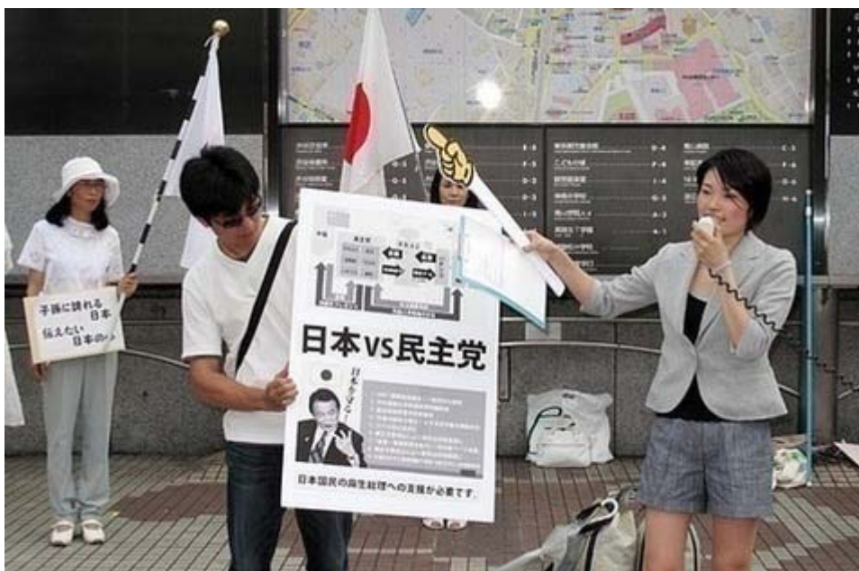
お若いのに訴えかけが上手な印象を受けました

今ひとつは、 未来 さんが大型パネルの図を示しながら 民主党 の政策・組織を判りやすく解説していた点です。「私は沖縄が大好きです。でも沖縄が中国の自治区になってしまうかも知れません。パスポートがいりますよ。皆さん、それでも良いですか？。これはもしかしたら来年、再来年の事かも知れません。いまからその話をしますので五分ほど聞いて下さい」。