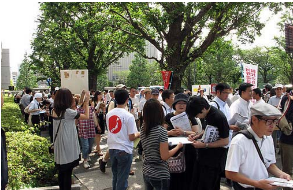
九段から靖国に致る道路はいつものように保守系の団体によるポラ配布、署名活動が繰り広げられ大にぎわいでした。