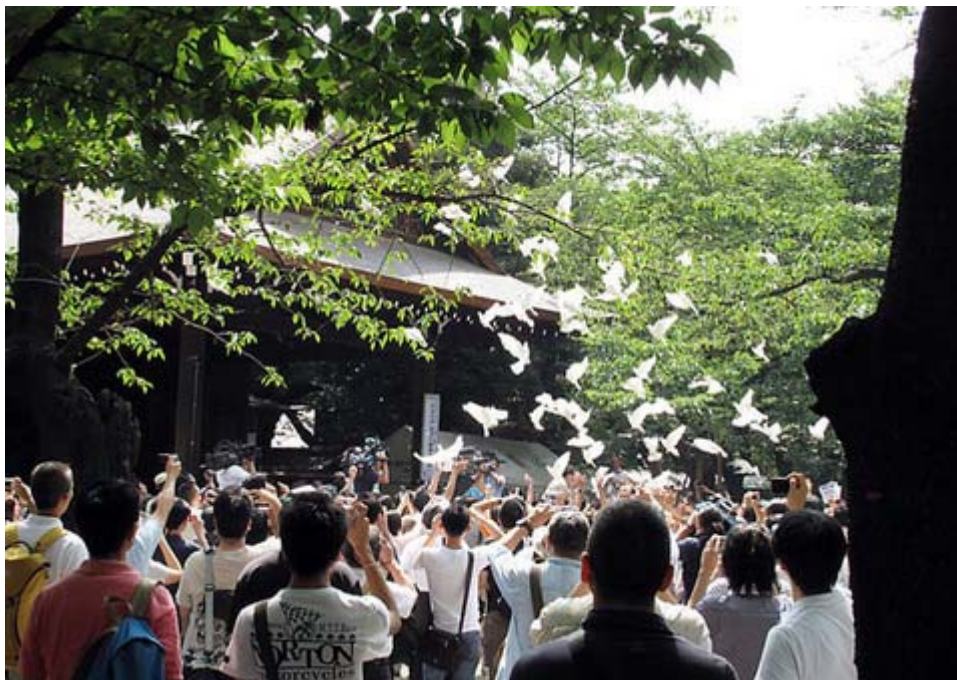
「日本の声—英霊に感謝する集い」放鳩式が午前10時から行われました。