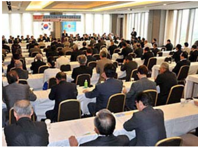
東京会館で「緊急全国地方団長・中央傘下団体長会議」