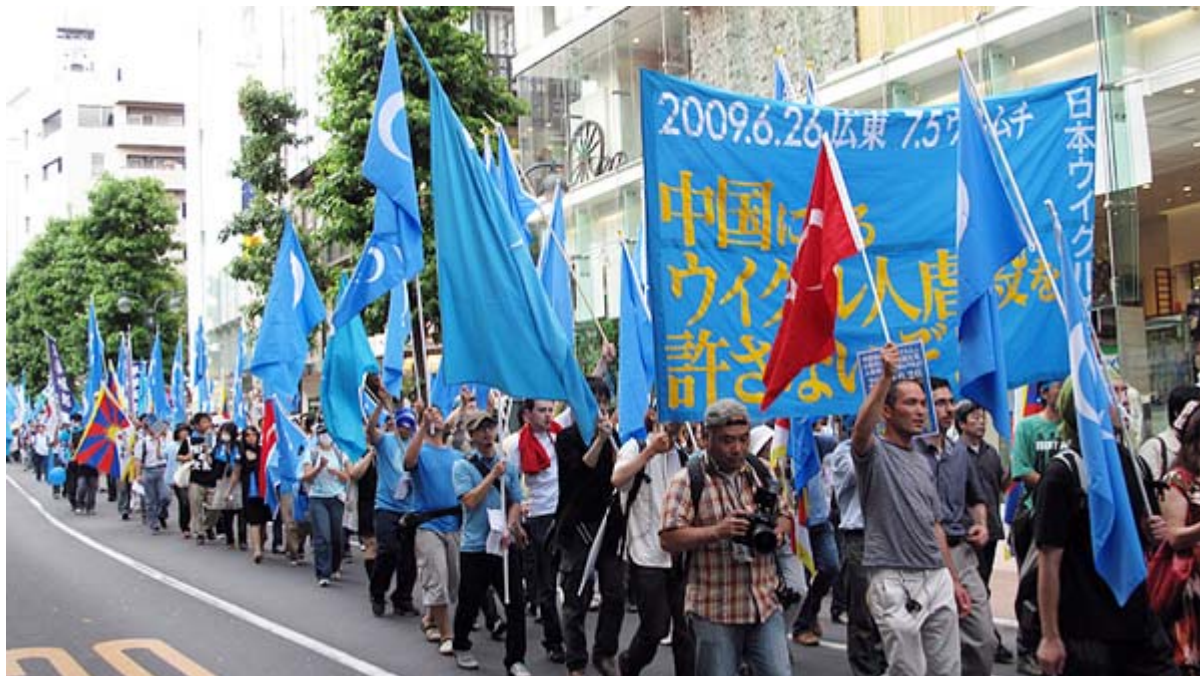
東トルキスタンのブルーの国旗が渋谷の街角で一段とさえ渡りました

この抗議の街宣・集会・デモを呼びかけたのは草莽全国地方議員の会とチャンネル桜でしたが、この呼びかけ人は数百人、数千人の会員や組合員を持っている訳ではありません。自らの媒体を通じて呼びかけ、それがネットで拡散し、一人一人が自主的に参加しているのです。