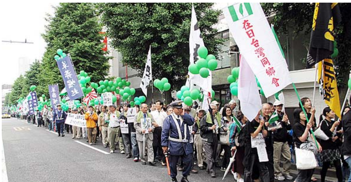
この画像は第二回目のNHK抗議デモの様子です

動画サイトをみれば、 民主党 政権の危険性を訴え、行動を呼びかける見事な動画が溢れています。ネットを見ない人にも知って貰おうと、チラシ集積サイトも複数作られ、プロ顔負けのすぐれたチラシが沢山 アップ ロードされ、それを印刷して数多くの人が配っています。