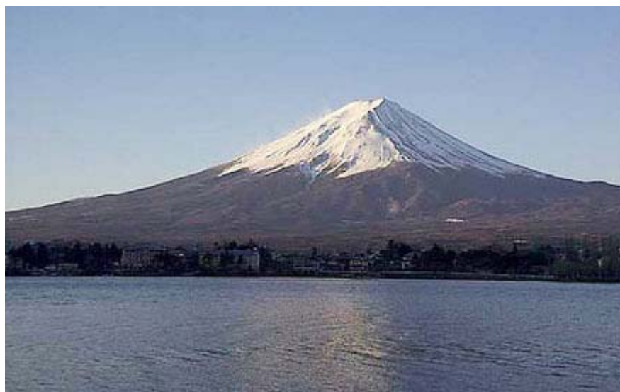
桜と並んで日本の象徴と言われる富士山、美しいです

「美しい国、日本」とは安倍首相の政権構想の中心であるが、それが「国民が美しい心根を持っている国」という意味では、日本は有史以来「美しい国」として、外国人から賛美されてきたのである。