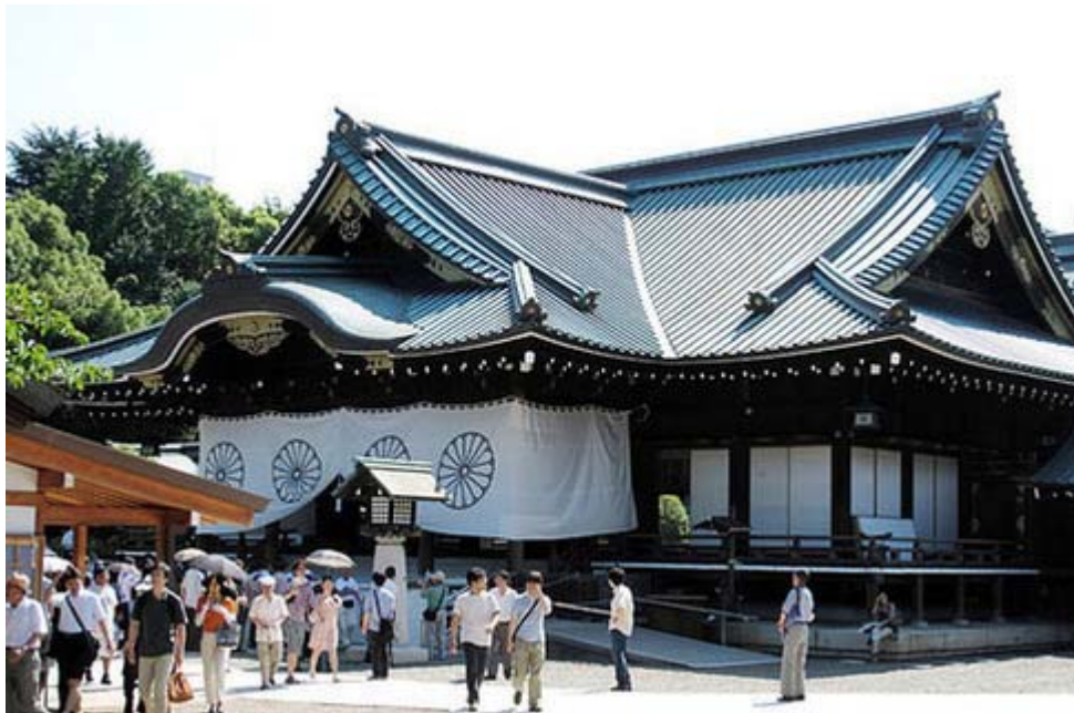
日本という国を今日まで引き継いでくれた英霊が祀られている靖国神社

正直、節儉、丁寧、清潔、その他わが国に於いて「キリスト教的」とも呼ばれる道徳のすべてに関しては、一冊の本を書くことも出来るくらいである。[1,p39]