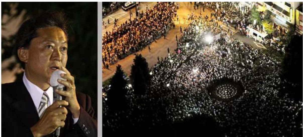
池袋駅西口での街頭演説で、最後のお願いをする鳩山由紀夫代表

産経報道にあるように、鳩山陣営には一人も日の丸がなかったというのですから、本当に保守層の支持が民主党に流れているのか？と云う感じがですね。池袋に集まった人の数でも日章旗に関しても、麻生陣営の圧勝でした。当然、麻生コールは始まりと終わりに自然発生的にわき上がったけど、由起夫コールが起こったか否かは判りません。