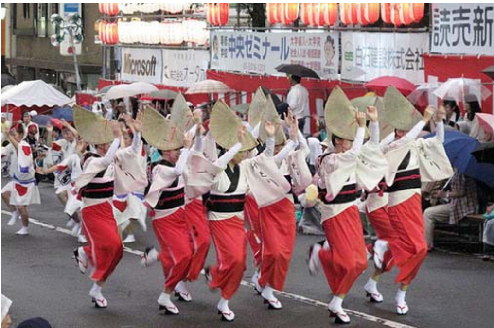
今や全国でもトップクラスの規模になった高円寺の阿波踊り(8月30日18時撮影)

なぜ、このような集団ヒステリー現象が周期的に起こったのか。「民衆が封建的支配のくびきから一時的に『解放』され、不満を発散するという役割をもっていた」(『日本歴史大辞典』河出書房新刊)という解説が多い。封建的支配のくびきというのは、左翼史観だから認めないが、なぜかお蔭参りは日本に独特な現象である。