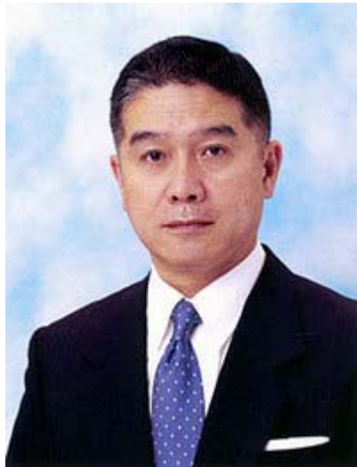
沖縄在住の評論家の論文だけに言葉に重みがありますね。 「敵艦を救助せよ！」を世に広げてくれた大功労者でもあります。

現在沖縄本島二カ所に、石油精製施設および貯蔵タンク群がある。これは米軍が有事の際、使用する計画もある。ところが今年五月、 全人代 二十六人が来県し、地元政財界と親交した。実はこの二十六人の中に、 中国 軍情報将校二人が紛れていた。彼らが最も注視、調査したのが、この石油精製、貯蔵施設であったのだ。