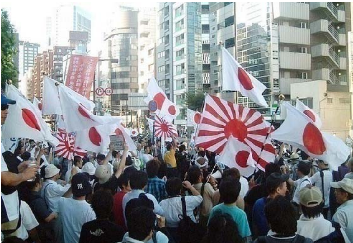
この迫力の数十倍の規模で国会と議員会館を取り囲みたい

プラカードも日章旗も幟旗でもなんでも手にしてデモに参加し、議員会館を取り囲みましょう。拡声器持参であらん限りのシュプレヒコールを叫びましょう。「皇国の興廃此の一戦に在り、各員一層奮励努力せよ」です。