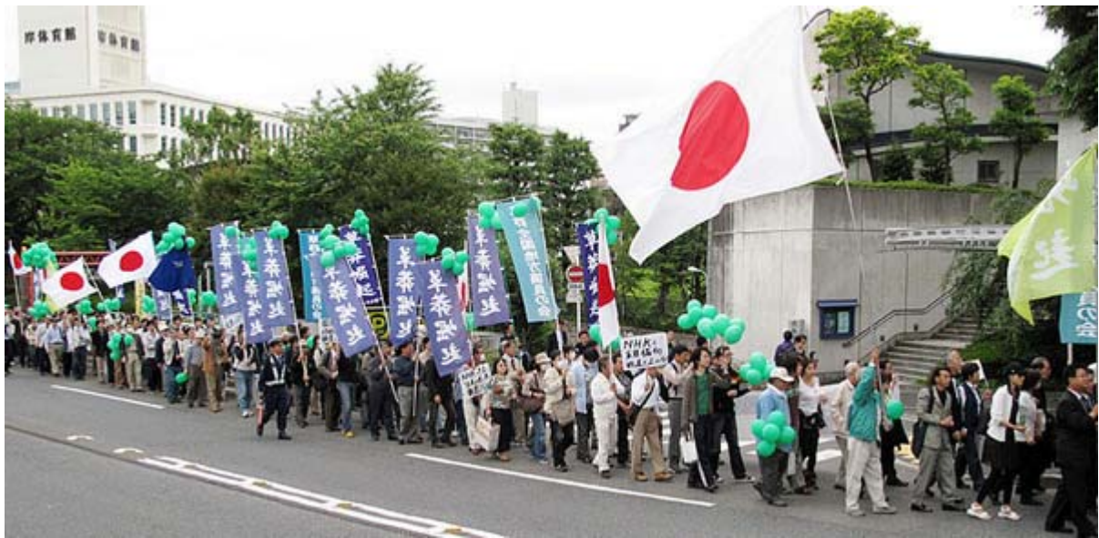
こちらは5月16日に行われたNHK糾弾デモのスナップです