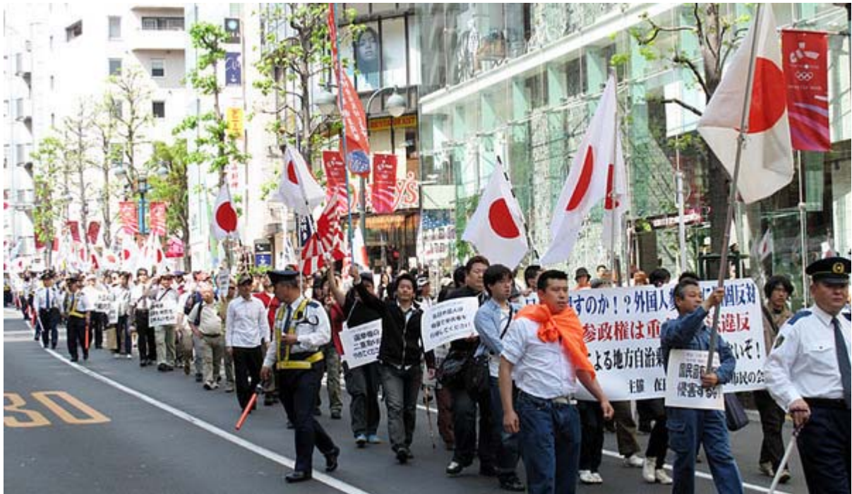
5月2日に渋谷で行われた外国人参政権反対デモのスナップです