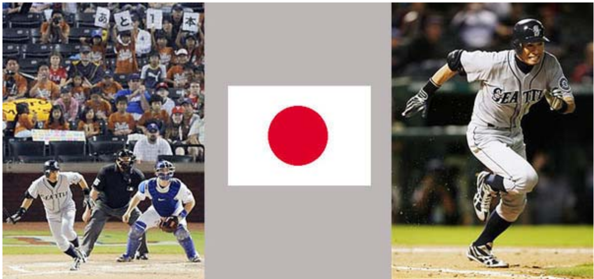
レンジャーズ戦の第2試合の2回、遊撃への適時内野安打を放ち、大リーグ史上初の9年連続200安打を達成したマリナーズのイチロー＝13日、レンジャーズ・ボールパーク(共同)とレンジャーズ戦の第2試合の2回、史上初の9年連続200安打となる遊撃への適時内野安打を放ち一塁へ走るマリナーズのイチロー＝レンジャーズ・ボールパーク(ロイター)産経ネットから。