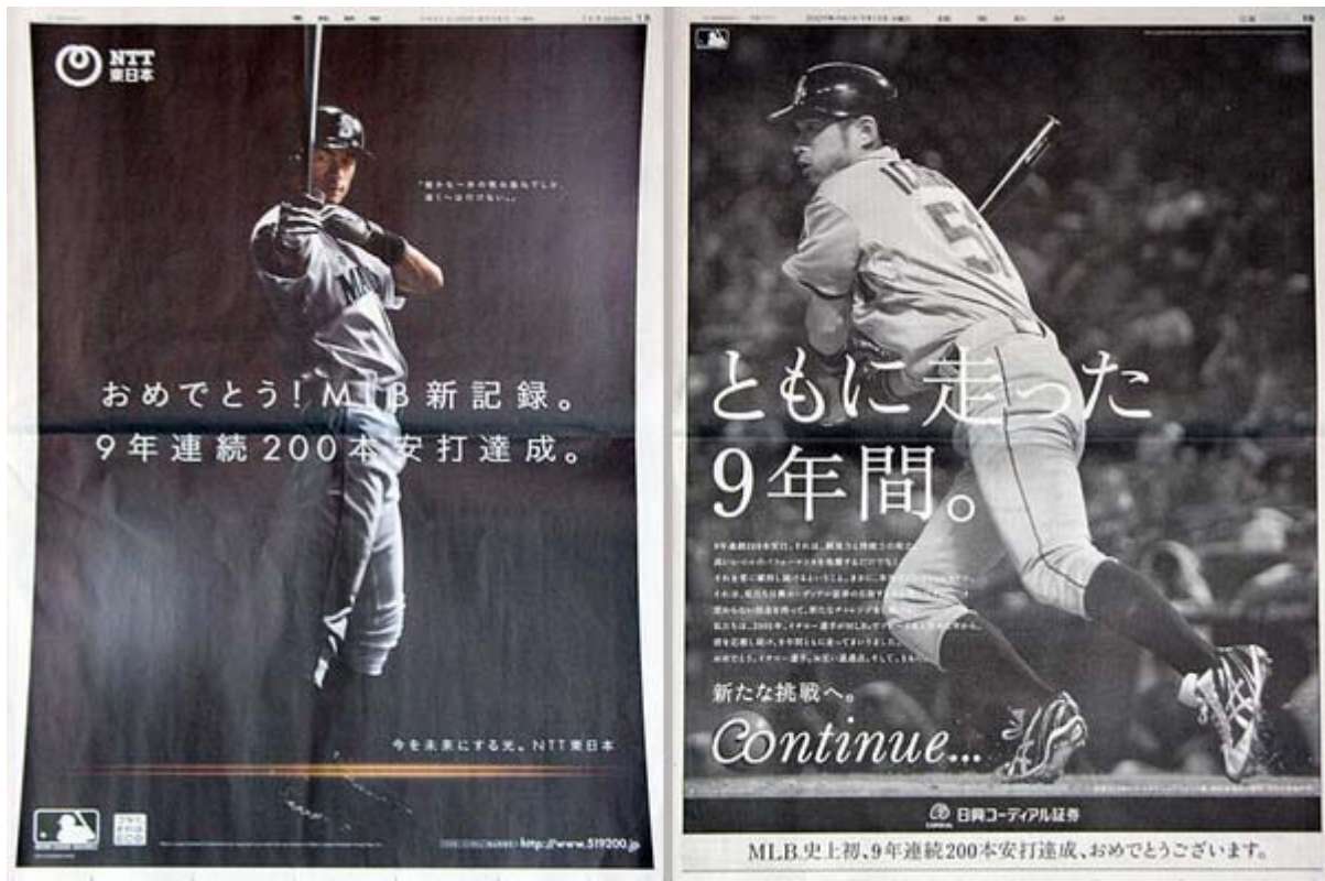
イチローの9年連続200安打達成を祝福する広告、NTT東日本(左、産経新聞)と日興コーディアル証券(右、読売新聞)

北朝鮮の独裁者金正日の医学的寿命の限界が見えてきた。数年以内に死亡や重病で執務不能になることが十分あり得る。2009年に入り後継者指名作業開始と国防委員会強化など金正日が焦っている表れと見られる兆候もでてきた。