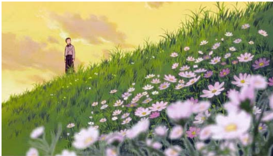
アニメ映画「ふるさと—PAPAN」から。美しい日本を守りたい。

日本を救うのは真実に気がついた我々が動かなければ、誰が動くのでしょうか？。既に反日政権は現実のものとなり、外国人参政権、人権救済法案という売国・亡国の両横綱という反日法案を早急に提出して成立させると明言しています。