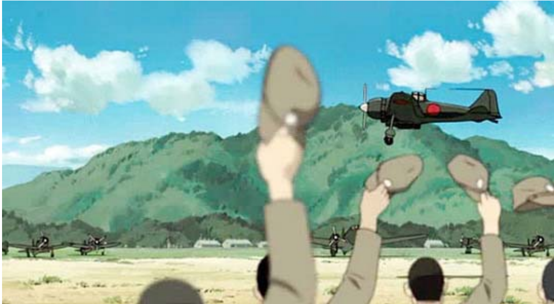
アニメ映画「ふるさと—PAPAN」から。英霊に報いるのが私達の使命です

テレビも新聞もですが、業績悪化が続きこのままでは先がないというなかでの、こうしたCMを出校する在日企業の意向はかなり大きなプレッシャーになるでしょう。その在日が経済力でマスコミを支配し、支援する 民主党 への著しい偏向報道を皆で揃って展開して、ついに悲願の民主党政権を誕生させました。