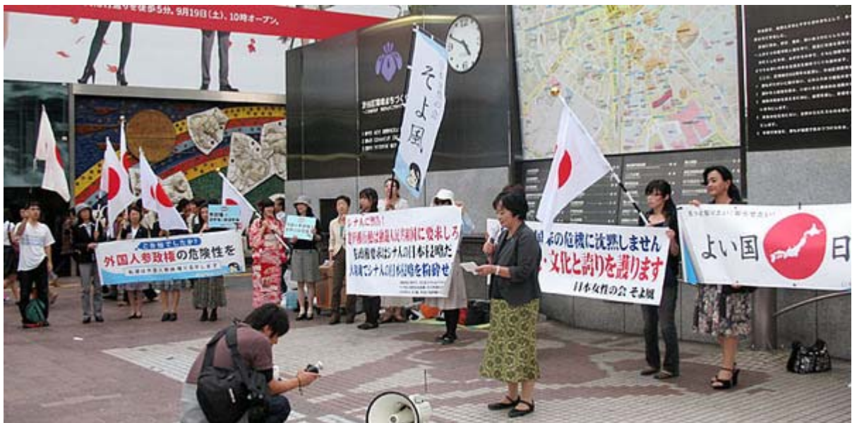
皆さん、勇気を持ってマイクで語りかけました

画像の「良い国 日本」、何か嬉しくなる横断幕です。「大和撫子は国家の危機に沈黙しません！日本の伝統文化と誇りを護ります」、これは力強い印象で、男性陣ももっとしっかりして下さい、と云われているような気がしました。一番上の「そよ風」の幡、可愛いですし、振袖に日の丸って、いままで余り見た記憶がないほどインパクトがあります。メンバーで相談しながらどんどん進化しているという印象です。