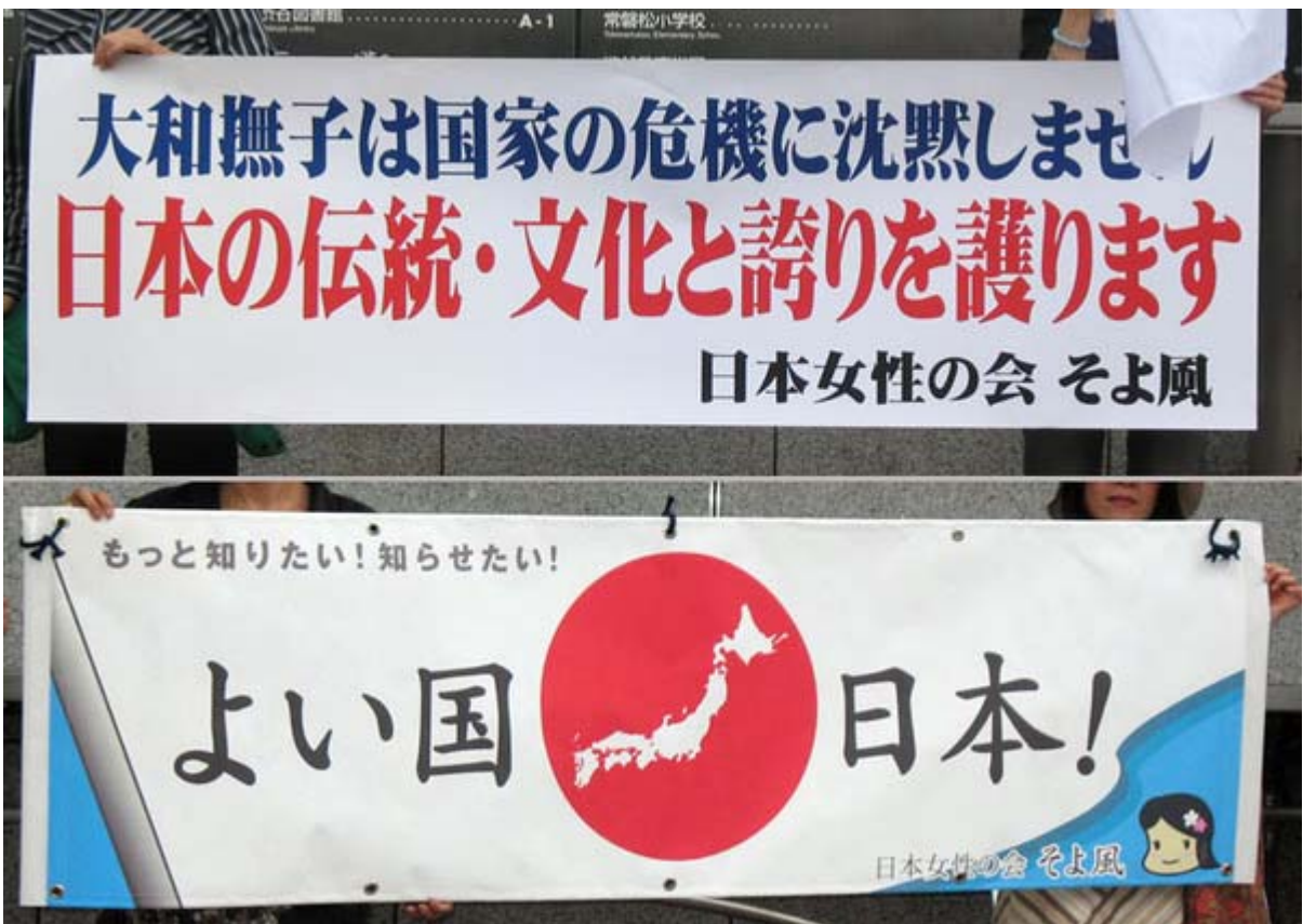
日の丸の中に日本列島が入っているのがよいですね。千島・樺太、沖縄列島も入れたいです。

いや～本当にその通りですね。「母が、妻が、そして娘が」とありますが、それどころかお孫さんのいる70歳を超えた元気なお婆さまも参加しています。既に会員は200人に迫る勢いと聞いてますが、この調子でどんどん女性パワーを結集して行動して欲しいとおもいます。普通の女性が日の丸の国旗を掲げてマイクで訴えると、明らかに効果が違うのです。