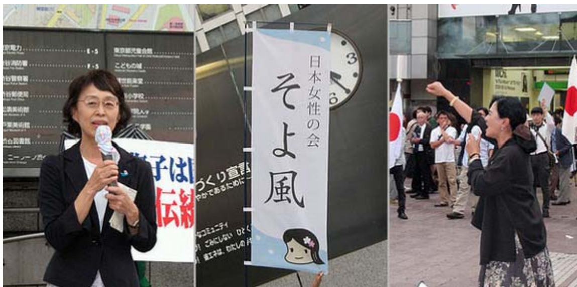
挨拶する涼風会長、おしゃれなそよ風の幟、このシュプレヒコールも気合いが入っていました

日本女性の会・そよ風が23日、渋谷のハチ公前広場で街頭宣伝を行い、連休最終日の夕方、渋谷に繰り出した多くの人に「日本は良い国だ」「外国人参政権反対！」を力強く訴えました。公安の調べでは主催者とその支援者の参加者は55人で、これまでにない規模となり、立ち止まって弁士の訴えに聞き入る人の数も過去最高という盛り上がりを見せました。