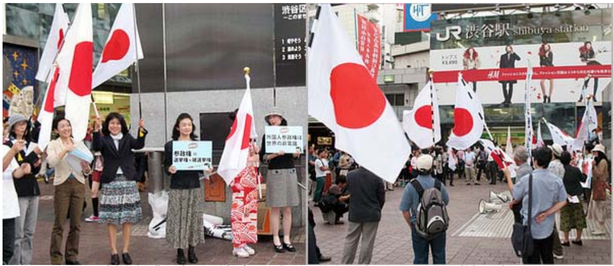
素敵な大和撫子が日の丸を掲げるのは本当によく似合います(両手に日の丸の女性もいますね)

画像の「良い国 日本」、何か嬉しくなる横断幕です。「大和撫子は国家の危機に沈黙しません！日本の伝統文化と誇りを護ります」、これは力強い印象で、男性陣ももっとしっかりして下さい、と云われているような気がしました。一番上の「そよ風」の幡、可愛いですし、振袖に日の丸って、いままで余り見た記憶がないほどインパクトがあります。メンバーで相談しながらどんどん進化しているという印象です。