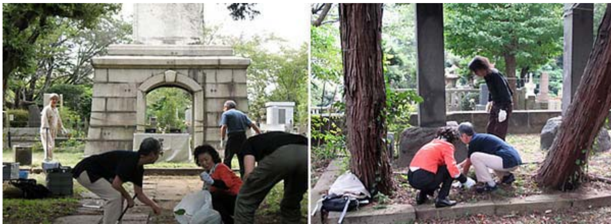
熱心に通路やお墓を清掃する参加者の皆さん

畝傍艦墓地と常陸丸墓地は櫻並木を挟んで相対してあります。軍人墓地ではありませんが、少し坂上がったところには軍神廣瀬中佐のお墓もあります。そこで、秋の彼岸に清掃参拝を考えております。参加者で清掃奉仕申し上げたのち、参加者で般若心経を読誦申し上げる、略式ではありますが仏式供養をいたしたいと考えております。*