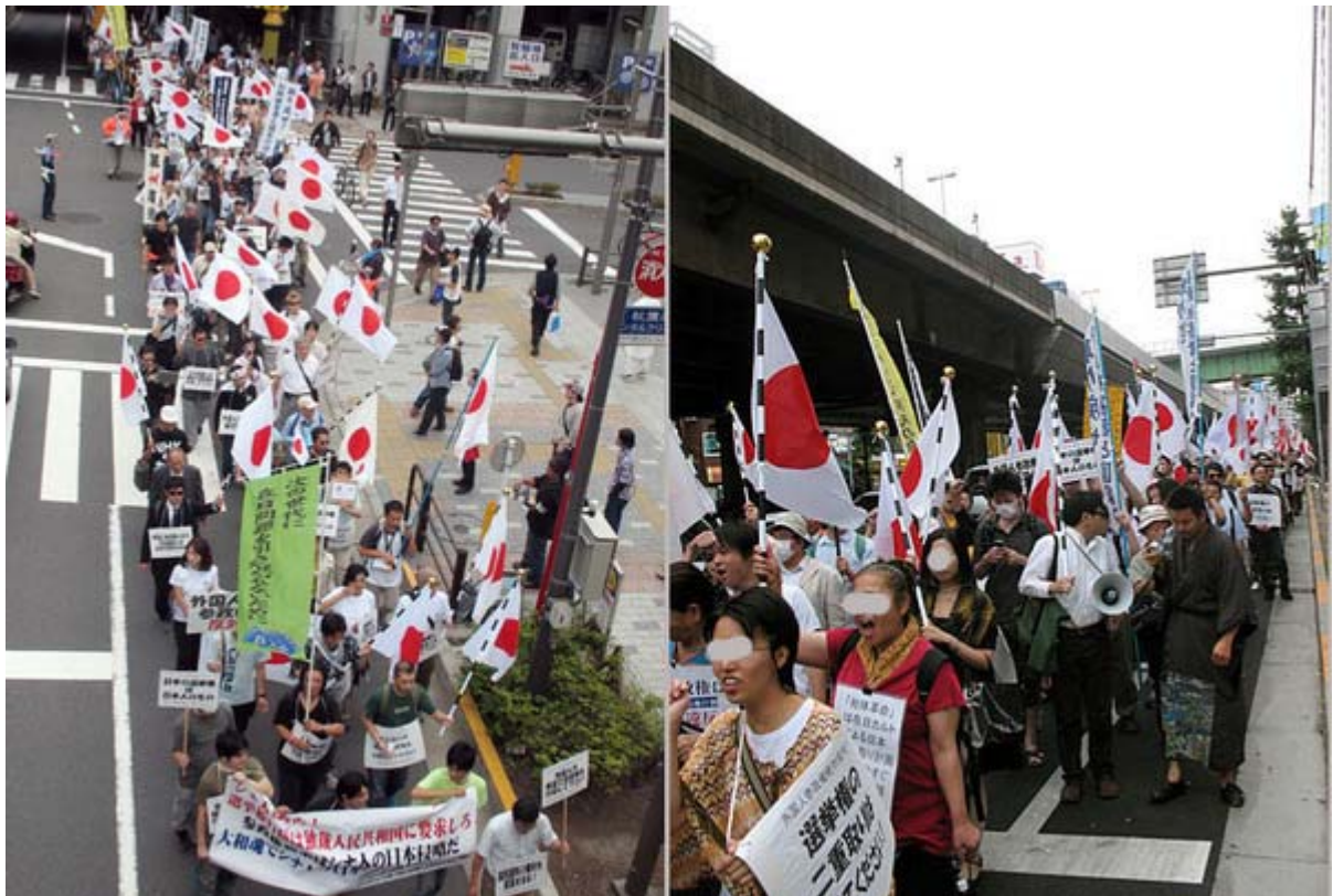
大きな声でシュプレヒコールを繰り返しながら秋葉原一帯をデモ行進

はじめてデモに参加された方も多いと思いますが、ひょっとしたらあまりの日章旗の多さ、言葉使いの過激さに引いてしまった方がいるかも知れません。しかしその辺のことは「よーめんのブログ」さんで過去に散々議論してきた経緯があるので、興味のある方は是非ともご覧頂きたいと思います。