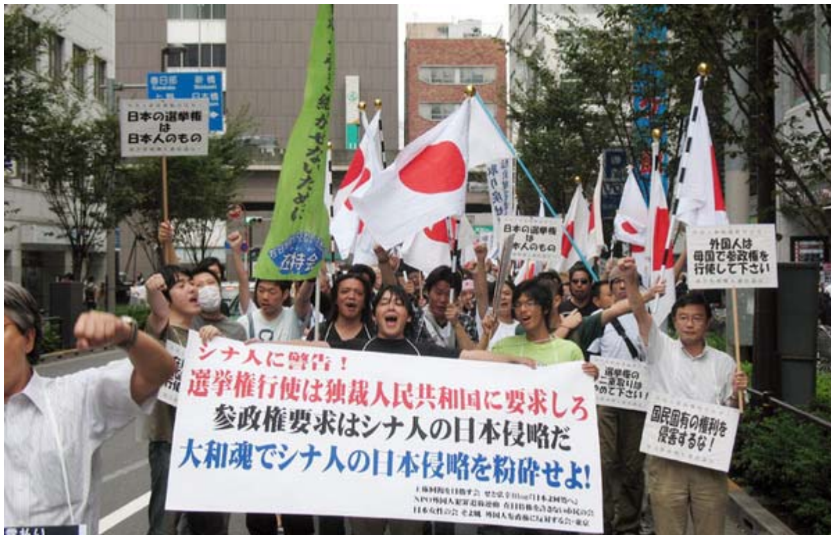
デモ隊の先頭、気合いが入っていました。

「特定外国人の地方自治乗っ取りを許さないぞ！」「憲法違反の外国人参政権を認めないぞ！」をキャッチフレーズに「外国人参政権断固反対！東京デモ」が27日、秋葉原周辺で行われ、主催者発表で500人（公安発表で400人）が気合いの入ったシュプレヒコールを繰り返しながら、道行く人にこの法案の危険性をアピールしました。（注、28日夜に開催された西村幸祐氏のトークライブでも氏が警察発表で750人と云っておられましたので数字を直しました）。