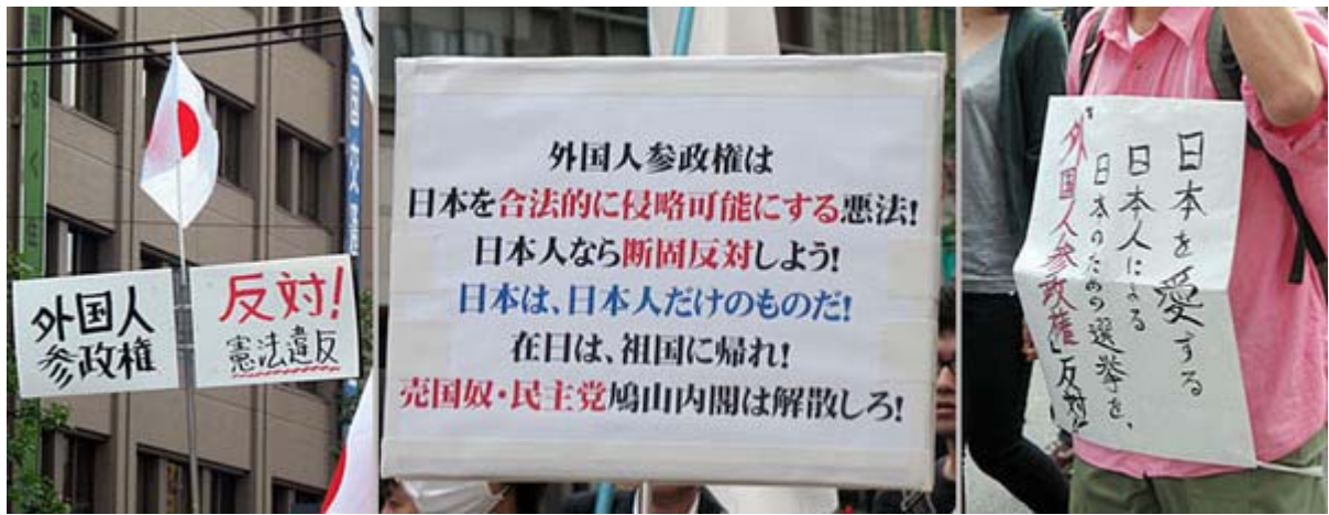
皆さん、いろいろ工夫してプラカードを制作して持参していました

ことここに至っては議論の段階は終わったと思います。出来れば、今回のデモのような危機感と怒りを共有しつつ、毎週末でも国会、議員会館、 民主党本部 、 民団 本部に千人以上の規模で「敵が参った」と云うまで抗議行動を繰り返す事が必要でしょう。さすがにマスコミも取り上げざるを得ないというところにまで持っていかなければなりません。