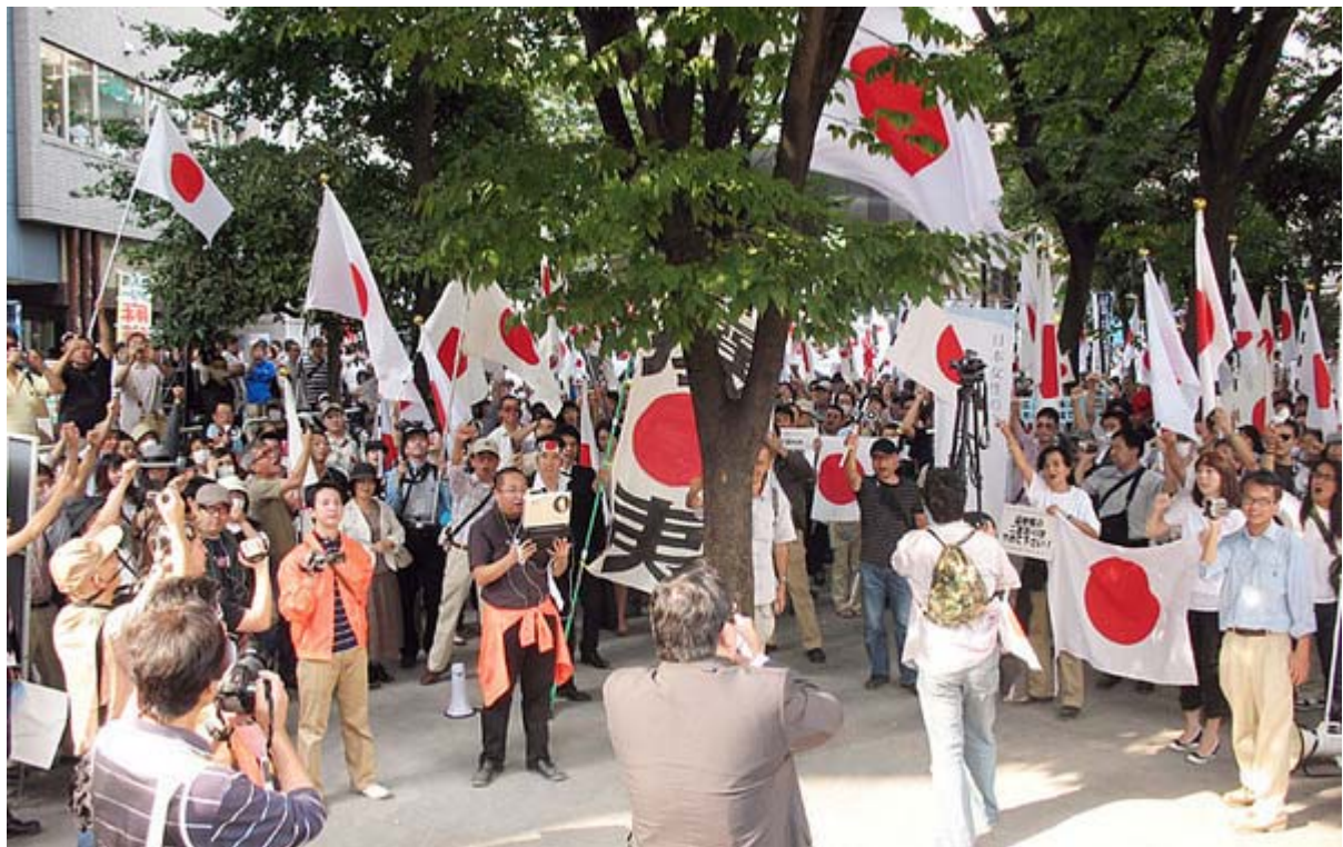
♫のシュプレヒコールも気合いが入っていました。まだ物足りないという方も多かったのでは?と思います

このあと、大きな抗議活動としては10月17日(土)と10月27日(火)が控えてますが、今回参加した皆さんも主催者は違うとしても是非合流して盛り上げて欲しいと思います。 民主党 が次々と成立を図ろうとしている反日法案の前では、多少の主義主張を乗り越えて「 団結 」までは行かなくても、 合流・相乗り 出来るはずですよ。