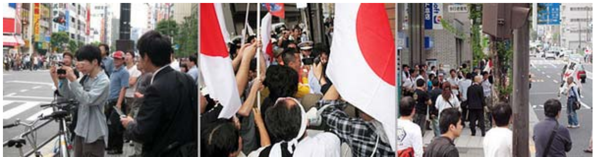
左から時ならぬデモ隊を撮影する市民、仕掛けてきた反日に反撃する参加者たち

ことここに至っては議論の段階は終わったと思います。出来れば、今回のデモのような危機感と怒りを共有しつつ、毎週末でも国会、議員会館、 民主党本部 、 民団 本部に千人以上の規模で「敵が参った」と云うまで抗議行動を繰り返す事が必要でしょう。さすがにマスコミも取り上げざるを得ないというところにまで持っていかなければなりません。