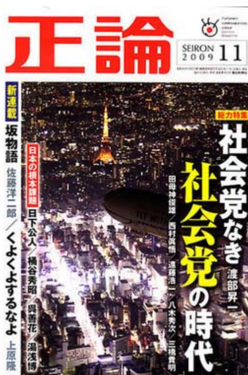
36周年を迎えた正論、表紙も紙面刷新で新たなスタートです

特集は「社会党なき社会党の時代」という、まさにそのものズバリのタイトルで、渡部昇一氏、西村慎吾氏、田母神俊雄氏、八木秀次氏、遠藤浩一氏、濱口和久氏、三橋貴明氏、諸星清佳氏、川崎昌平氏が寄稿、宮崎哲弥氏に司会による産経新聞記者による座談会が組まれています。