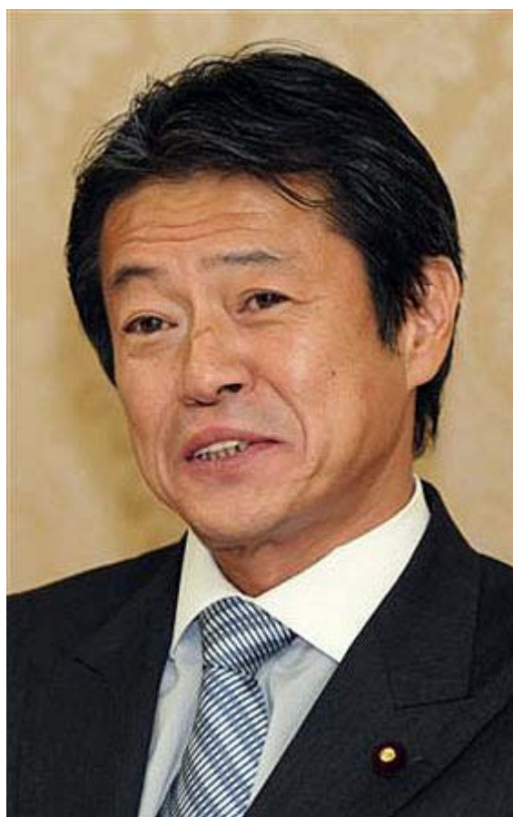
安らかにお眠り下さい。貴方の志はしっかり受け継ぎますから(産経ネットから)。

彼はその日記の最後に、「 自民党 は末期的だが、今こそ日本の保守の軸を改めて確立するために全力を尽くすべきだ。さもなければ、日本は世界の中で埋没しながら自壊してゆく」と結んでいます。これは真性保守の政治家・中川昭一氏のいまとなっては事実上の「遺言」でしょう。その日記の後半部分が以下です。