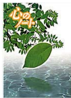
心のノート 中学校