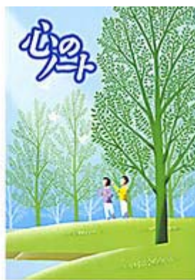
心のノート 小学校5、6年