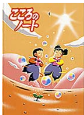
こころのノート 小学校1、2年