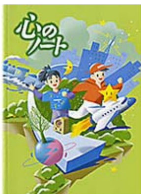
心のノート 小学校3、4年