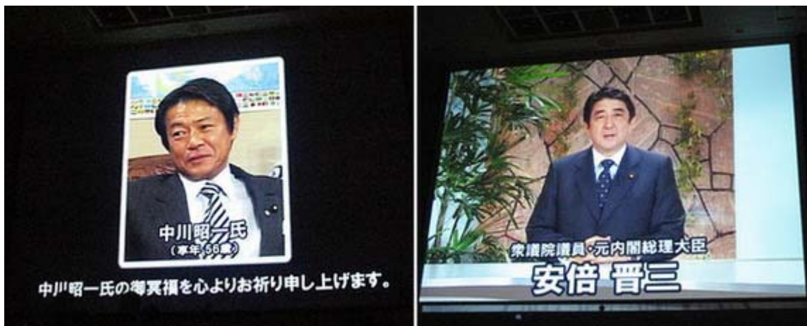
スクリーンで登壇したのは故・ 中川昭一 氏と保守再生を誓う 安倍晋三 元首相でした

抗議集会は最初に全員起立しての国歌斉唱で始まり、続いて先頃急逝された故・ 中川昭一 氏へ黙禱、そして全員で「海ゆかば」を斉唱して追悼しました。生前の中川氏の笑顔の写真がスクリーンに映し出され、「海ゆかば」が流されると私は胸にぐっと来るものがあり、涙が止まりませんでした。素敵な配慮をしてくれた主催者に感謝したいと思います。