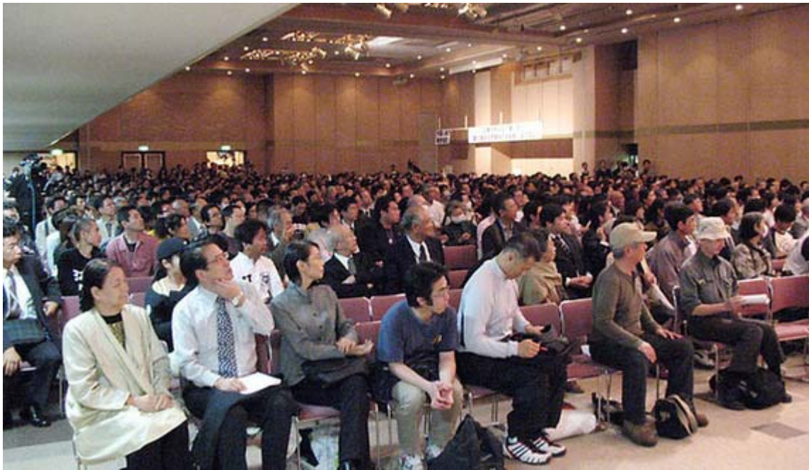
写真では見にくいかもしれませんが後方の扉の後ろにも入りきれない人が沢山いました

抗議集会は最初に全員起立しての国歌斉唱で始まり、続いて先頃急逝された故・ 中川昭一 氏へ黙禱、そして全員で「海ゆかば」を斉唱して追悼しました。生前の中川氏の笑顔の写真がスクリーンに映し出され、「海ゆかば」が流されると私は胸にぐっと来るものがあり、涙が止まりませんでした。素敵な配慮をしてくれた主催者に感謝したいと思います。