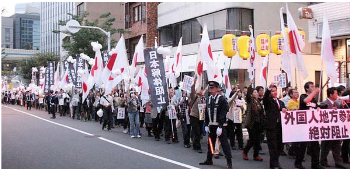
1500人が参加したデモ隊の一行、左奥の後方の建物が民主党本部です

民主党政権が誕生して一ヶ月、次々と反日法案が明らかにされているタイミングでの集会ただだけに、登壇者の訴えかけ、スピーチはこれまでに見られないほどの熱さ、テンションの高さ、危機感がひしひしと伝わり、会場からその都度大きな拍手やかけ声が上がっていました。