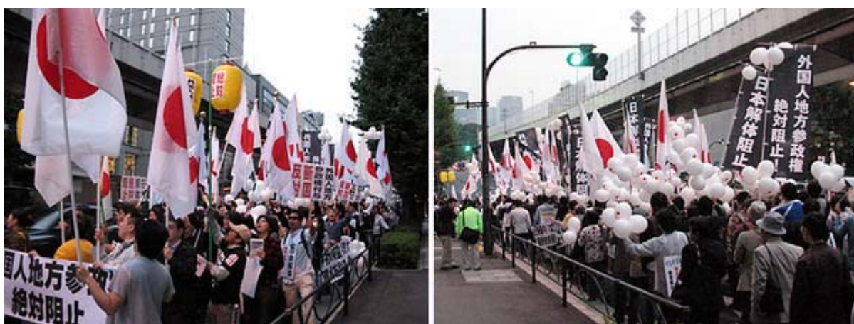
シュプレヒコールを大声で叫びながら抗議デモを行いました、日の丸が美しいです

この模様はチャンネル桜でダイジェスト版が10月19日放送の桜プロジェクトで、詳細な内容も10月23日のSO-TVで一挙に放送する予定ですので是非ご覧下さい。また既に産経新聞も「 日本解体を阻止せよ 」保守派議員が総決起集会 政権への批判続出との見出しでニュースを配信してくれています。