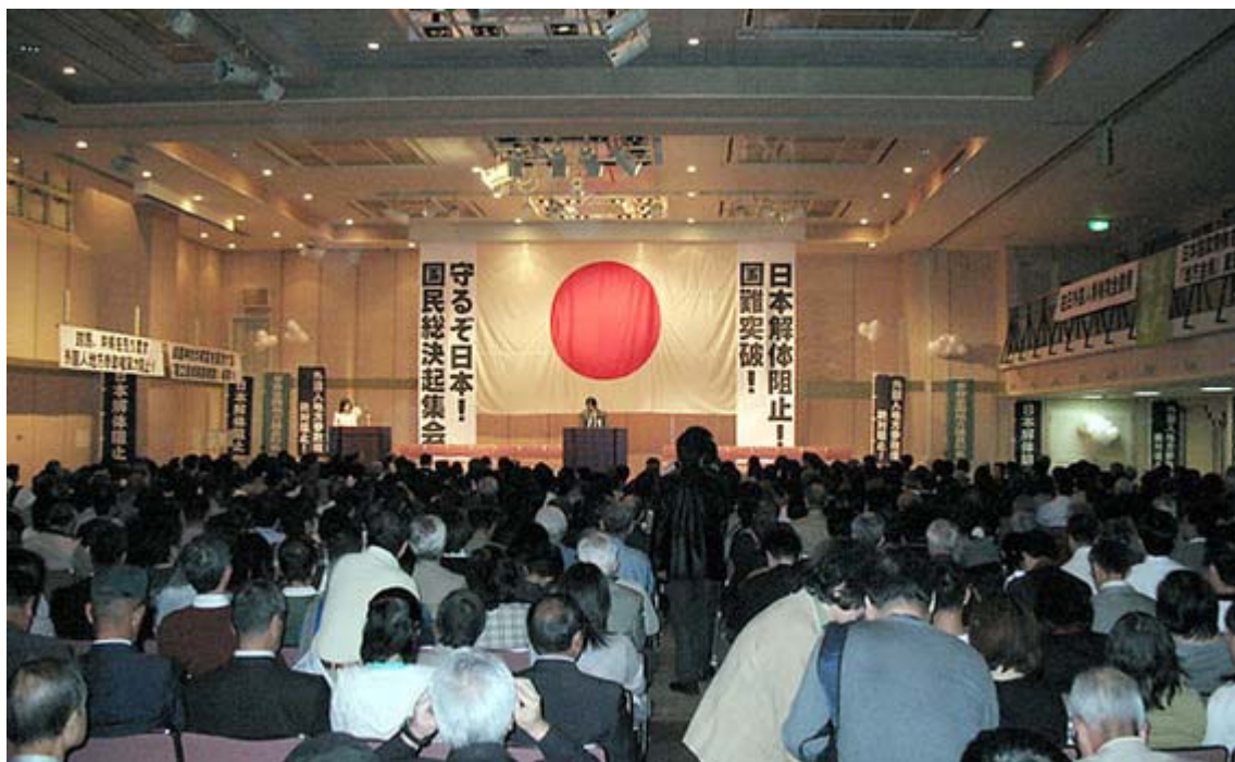
間もなく開会というタイミングでの会場の全景です。どんどん入って二階も解放されました

日本解体阻止！「守るぞ日本！国民総決起集会&デモ」が10月17日、午後一時から永田町の砂防会館別館「シェーンパッハサポー」大会議室で開催され、定員を大幅に上回る1400人もの参加者を集めて盛大に開かれました。主催したのは草莽全国地方議員の会、 日本文化チャンネル桜 二千人委員会有志の会ほか。数多くの登壇者も参加者も日本の危機を目の前に控え、これまでにないテンションの高さ、気合いを感じさせる集会となりました。