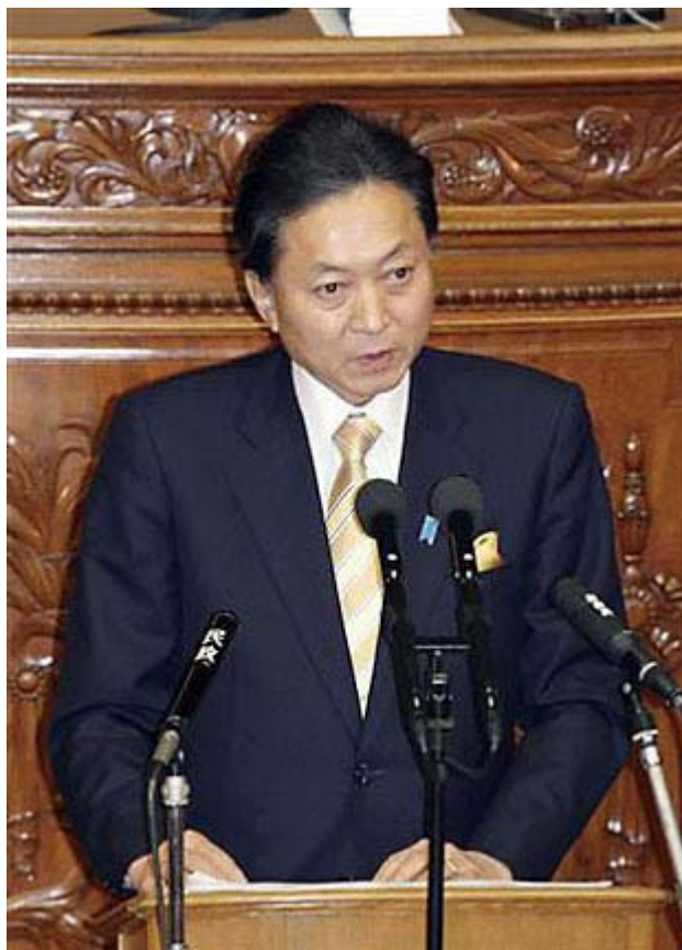
いつ見てもこの人の表情には何か引っかかるモノがあります?

いや～守護霊、背後霊、エトヴァスに夢遊者という言葉まで出てくるとは何とコメントして良いやら判りません。でも何となくそう思わせるものを確かに感じますね。加えて幸婦人がこれに輪を掛けているからどうにもなりません?。ここまで軽い人間が日本の総理大臣で、 国連 や諸外国に出かけては好き勝手な約束をされたらたまりません。で、どのくらいのブレなのか、ちょうど発売されたWILL12月号に阿比留さんがズバリ書いてますので、以下、政治資金の部分だけですが引用します。(WILL12月号P65-67)