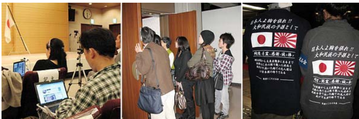
ノートパソコンでネット中継されました、ご覧のように入り切れない人が沢山いました、外では英霊にこたえる会の方が心を打つスピーチをしてました。

私は当然、集会も全員で国歌斉唱で始まったとばかり思っていました、それがなく、逆に最後に演奏無しで「君が代斉唱」を行うなど、通常の集会の進行とは違う部分で首をひねることになりました。そういえば一般のテレビ局はともかく、チャンネル桜のカメラまでが入っていないのは驚きました。