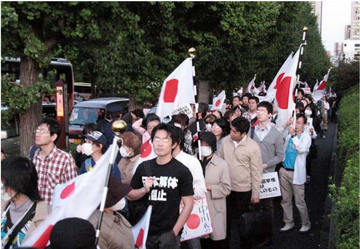
日比谷公園から国会議事堂をぐるりと回って憲政記念館へ、 約900人が移動(デモ)に参加してくれました

「日本解体法案」反対請願受付集会 & 移動が27日、日比谷公園から国会周辺、そして憲政記念館ホールで盛大に行われました。主催者発表では移動と集会に参加したのは約三千人、公安の見解は移動に900人、集会に500人の計1400人、私の見た目での判断はその中間の二千前後ではないか思います。参加された皆様、本当にありがとうございました。平日でこれだけの動員は「凄い！」と思います。