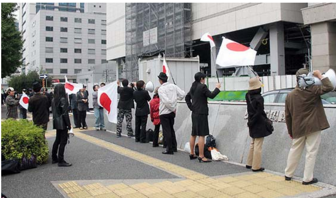
参議院議員会館前で抗議をする参加者の皆さん

この「外国人住民基本法」は、外登法問題と取り組む全国キリスト教連絡協議会(外キ協)が1998年1月15日に発表したものです。既に10年以上も前のことで、要は在日韓国朝鮮人のこれ以上はない傲慢な要求を羅列したとんでもない法案で、これが通れば外国人参政権など不必要という仰天の内容です