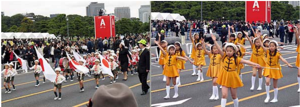
可愛いちびっ子達のパレード、沿道から拍手が上がっていました