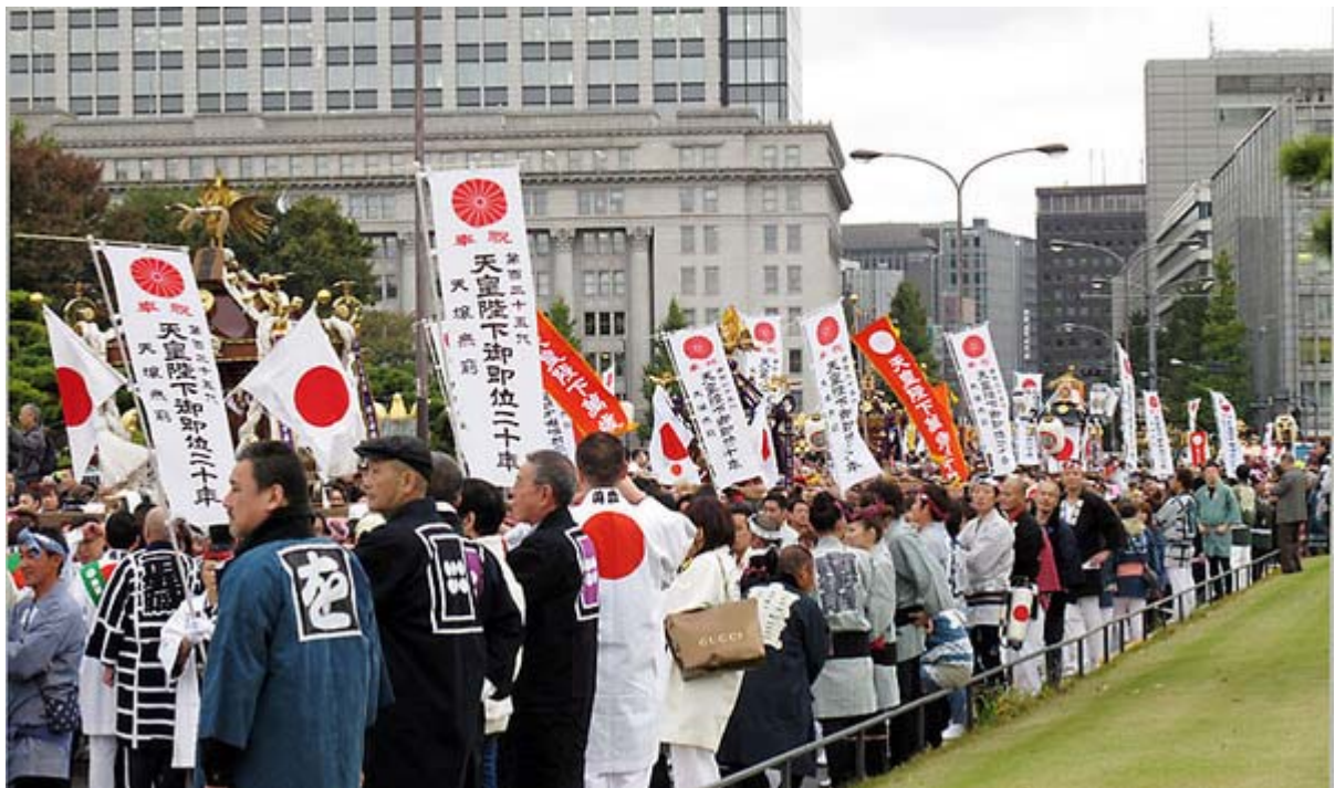
奉祝渡御(お神輿の練り歩き)の全景、雰囲気伝わりますでしょうか?