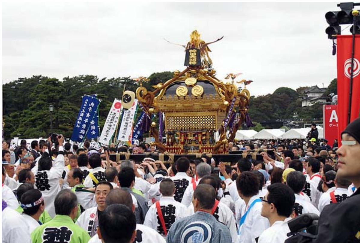
皇居をバックに神田明神の巨大な宮神輿が練り歩きました

東京の神輿が集まると聞いていたので期待していましたが、やはり良いですね。神田明神の大きな宮神輿も登場しましたし、恥ずかしながら神輿に日章旗がクロス状に飾られる光景をはじめってみました。当然と言えば当然なのですが、実によく似合います。でも、正直言って寒かった、コートを着て行ってよかったです。