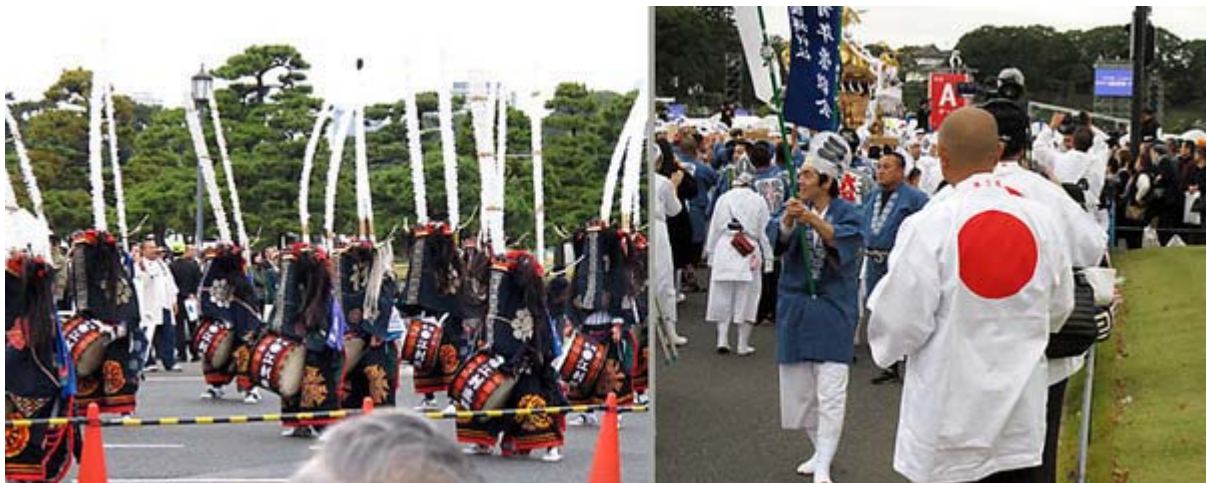
迫力あった奥州江刺百鹿大群舞(岩手県)、日の丸の半纏、私も欲しくなりました