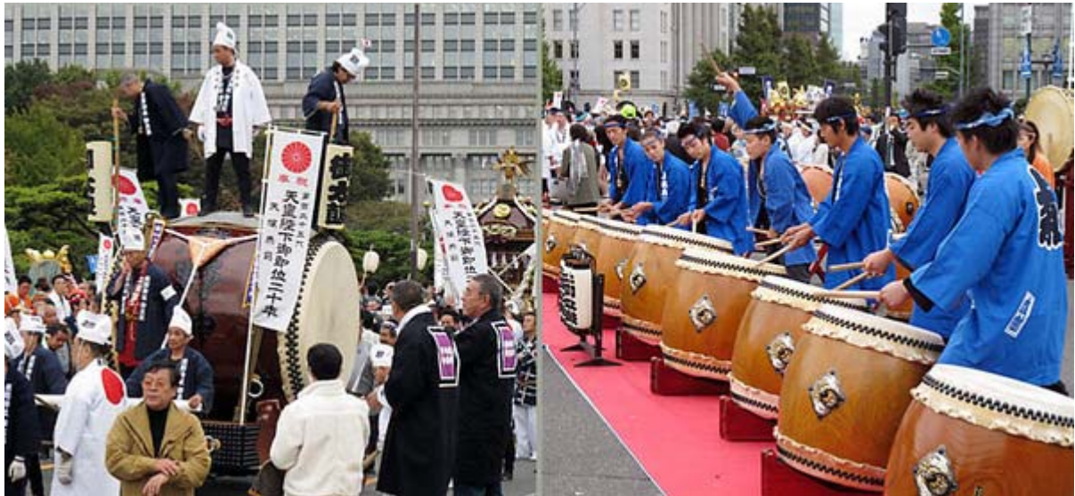
恋ヶ窪熊野神社の御太鼓、はじめてみましたが独特のスタイルです