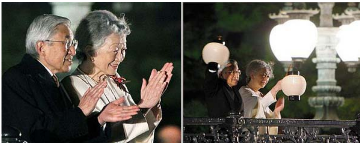
即位20年を祝う国民祭典で、参加者の万歳三唱にちょうちんを振ってお応えになる両陛下