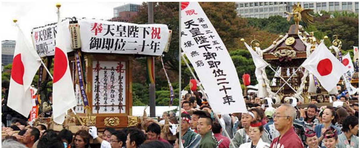
普段には見られない神輿の飾り付け、日の丸がよく似合います