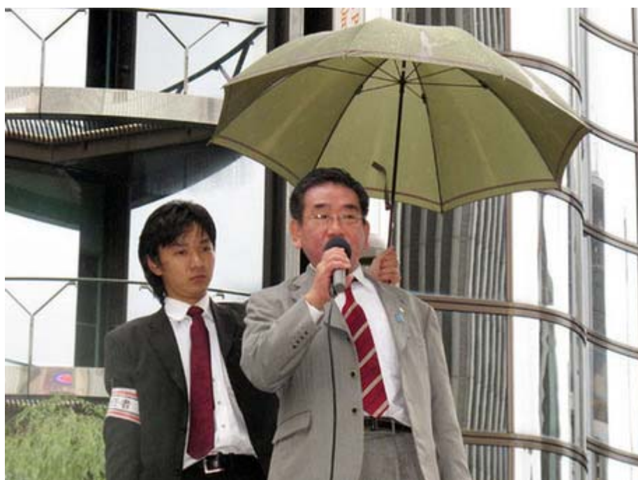
「国士」とはこの人のこと。本当に彼の政治活動には頭が下がります

従って、14日の東京街頭での外国人参政権付与反対と15日の大阪街頭でのNHK糾弾は、共に、 中国共産党 の日本支配の謀略を打ち砕くための不可分の国民運動といえる。