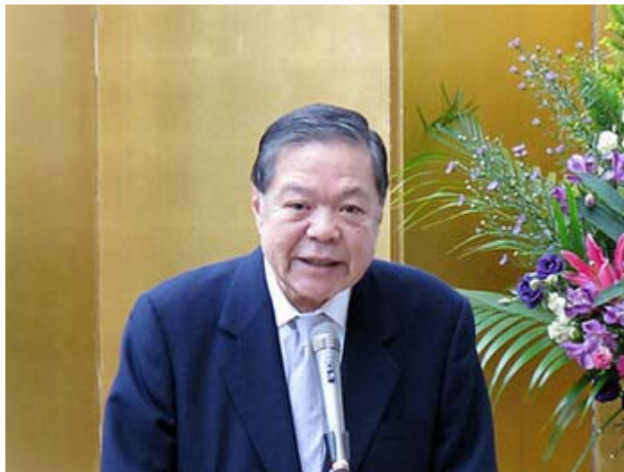
鳩山政権の外交はゼロ以下のマイナス点と評価する外交評論家の加瀬英明氏

鳩山首相は胡主席に経済や安全保障について共通政策をとる、東アジア共同体をつくろうと提言した。だが、「東アジア共同体」といっても漠然として、具体的な内容がまったくなかった。構成国すら分かっていなかった。この「東アジア共同体」は、まだ構想とすら呼べるものでなかった。