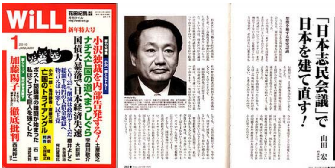
WILL1月号は税込み780円で全国の書店にて好評発売中です

松下政経塾 出身の政治家としてはピカーでしょう。紛れもない真性保守、しかも十年間の区長の経験で実践し驚くべき成果を上げている。「よい国つくろう！日本志民会議」が来年の参議院選挙にどう向かおうとしているのか判りませんが、この政治団体が飛躍して一大ブームを起こし、もって保守中心の政界再編の軸となって欲しいと思います。