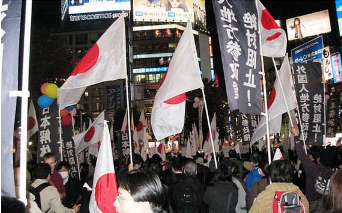
暗くなってもハチ公前は人、人、人の熱気で埋め尽くされました

「今までも、国会はいろんな角度から撮られているのがわかってる。こういうことをしたら映るかもしれないという、そういう予測がつかないもんかなと。手先のことしか考えなくなっちゃうのかと思うと、やはりね。ささいなことなんだけど、こういう姿勢がね、この大変なときにね、一生懸命、我々も支持率を下げないでね、辛抱して支えてるのに、何なんだよと。そういうことになってしまうんで。ささいなことのようにだけど、重なるとボディーブローのように効いてくる。」