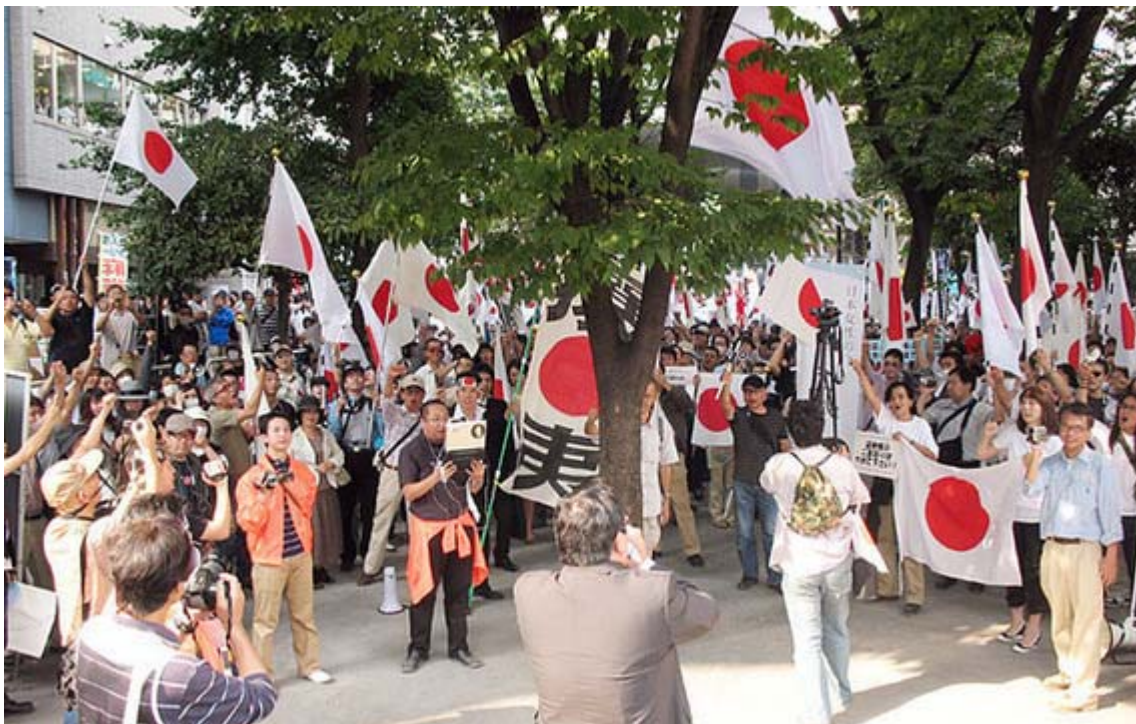
750人が参加した秋葉原デモ。最高に気合いの入ったデモでした。

これに習い、我々も抗議のファックスを入れる場合、一時的に集中して終わるのではなく、例えば外国人参政権を推進している民主党議員には毎日、コンスタントにしつこく選挙で落とされるまで日課として送る、という継続性が大事だと思います。