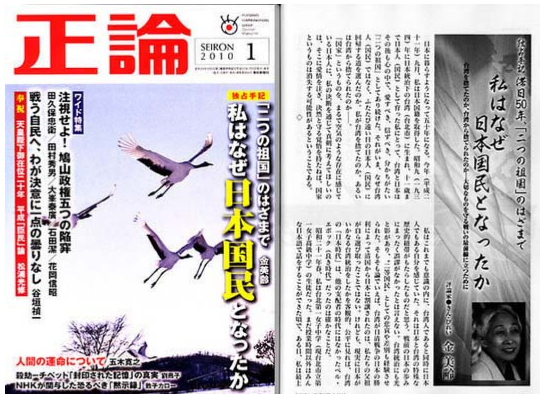
正論新年号は税込み740円で好評発売中です(画像クリックで目次のページにジャンプします)。

銭氏ははっきり、「日本は中国に制裁を科した西側の連合戦線の中で弱い部分であり、おのずから中国が西側の制裁を打ち破る最も適切な突破口になった」と指摘、天皇訪中が実現すれば、「西側各国が中国との高いレベルの相互訪問を中止した状況を打破できるのみならず、(中略)日本の民衆に日中善隣友好政策をもっと支持させるようになる」と書いた。