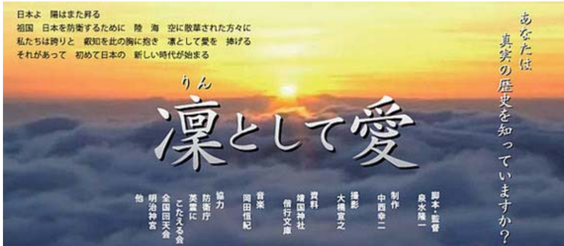
何と幻の名画「凛として愛」が奇跡的に復活上映される事になりました。 画像クリックで告知ページに飛びます。