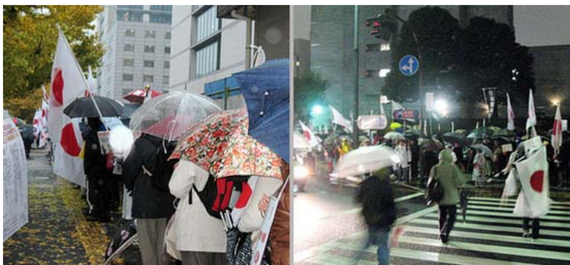
日章旗がず〜と奥の方まで伸びているのが判るでしょうか、真っ暗の中での 民主党 前街宣です(ブレてます)

民主党 本部前ではこれまでに様々な団体が数々の抗議の街頭宣伝が行われてきたわけですが、今回はこれまでで最大規模だけに、本部ビルから我々を除いている人の影がよく見えました。移動中に確認できたのですが、隊列最後方には若い女性達の姿が非常に多く、正直ビックリしました。最後には君が代を斉唱して散会しましたが、主催者発表では参加者は約300人とのことでした。確かにその後にごんごん増えていました。