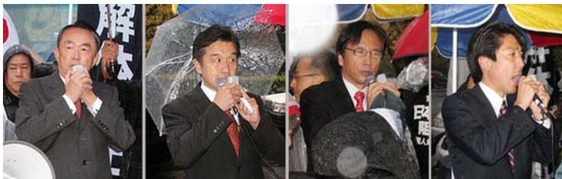
雨の中参加してくれた議員さん。左から平沼起夫、赤池誠章、土屋たかゆき、城内みのるの各氏。

平日の昼間、しかも寒くて雨というコンディションの中、公安の方に聞くと既に200人いるとのこと、「ああ～良かった」と安心しました。聞くと愛知県や岐阜県など遠隔地からの参加者もいるとのこと。それだけ皆さんの危機感の強さが伺われるわけで、私も今回は撮影取材よりも旗を掲げて抗議団の一員として参加しました。