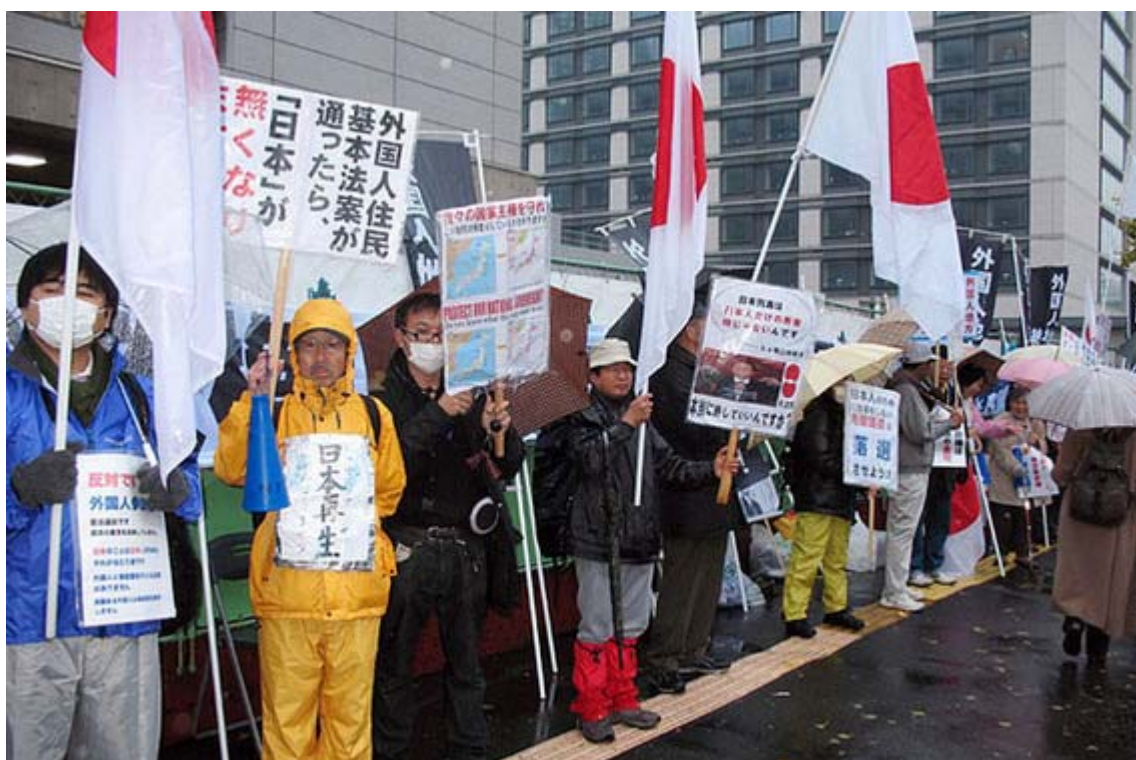
日の丸とプラカードを掲げて長時間頑張ってくれた抗議に参加された皆さん

これは11月28日の大抗議行動に続く「日本解体阻止！外国人地方参政権絶対阻止！守るぞ日本！国民大行動 第4弾！国会前座り込み街頭宣伝活動」で、呼びかけたのは草莽全国地方議員の会、外国人地方参政権絶対阻止行動委員会、 日本文化チャンネル桜 二千人委員会有志の会などです。