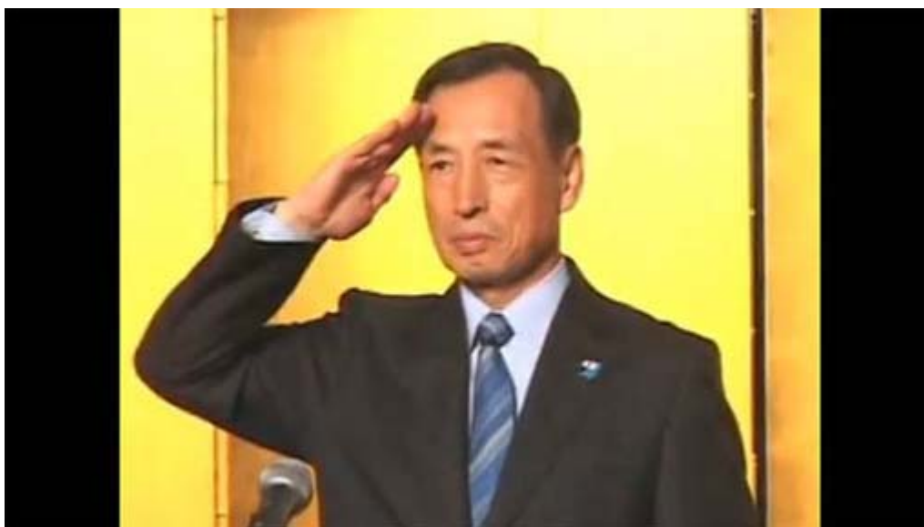
一年遅れの離任・退官式での田母神閣下荣誉礼！（画像クリックでHPにジャンプします）

あれから一年、「クビ」になるやいなや、全国から講演依頼、執筆依頼、テレビ出演依頼が殺到、一躍時の人となって現在でも月に20回平均の講演をこなしているそうです。田母神氏の話す近現代の日本の歴史、自虐史観教育をひっくり返す話の内容は、本来なら「一般の人」が避けるような本質的な歴史観です。