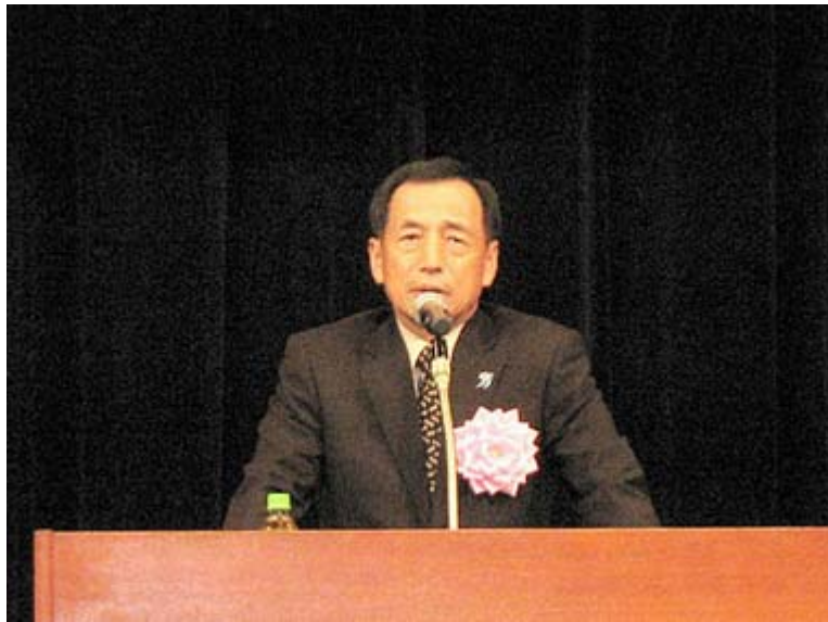
ジョークにもますます磨きが増かった田母神閣下の講演