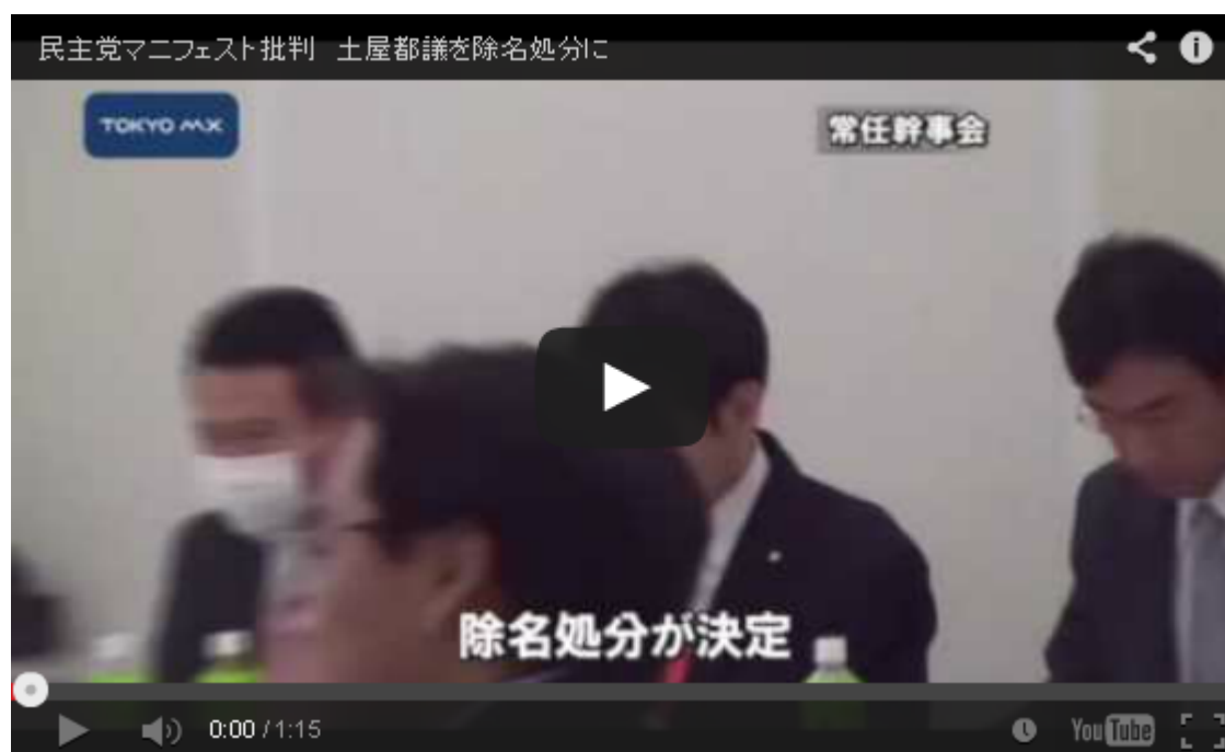
映像の中に長島昭久議員の姿が見えますね。 「笑っている場合か！」何をしているのだ？

諸氏は、ここで、文化防衛論を読み直すべきだ。答えはそこに書いてある。（“今日のつっちー”2009年12月8日(火) No.465）