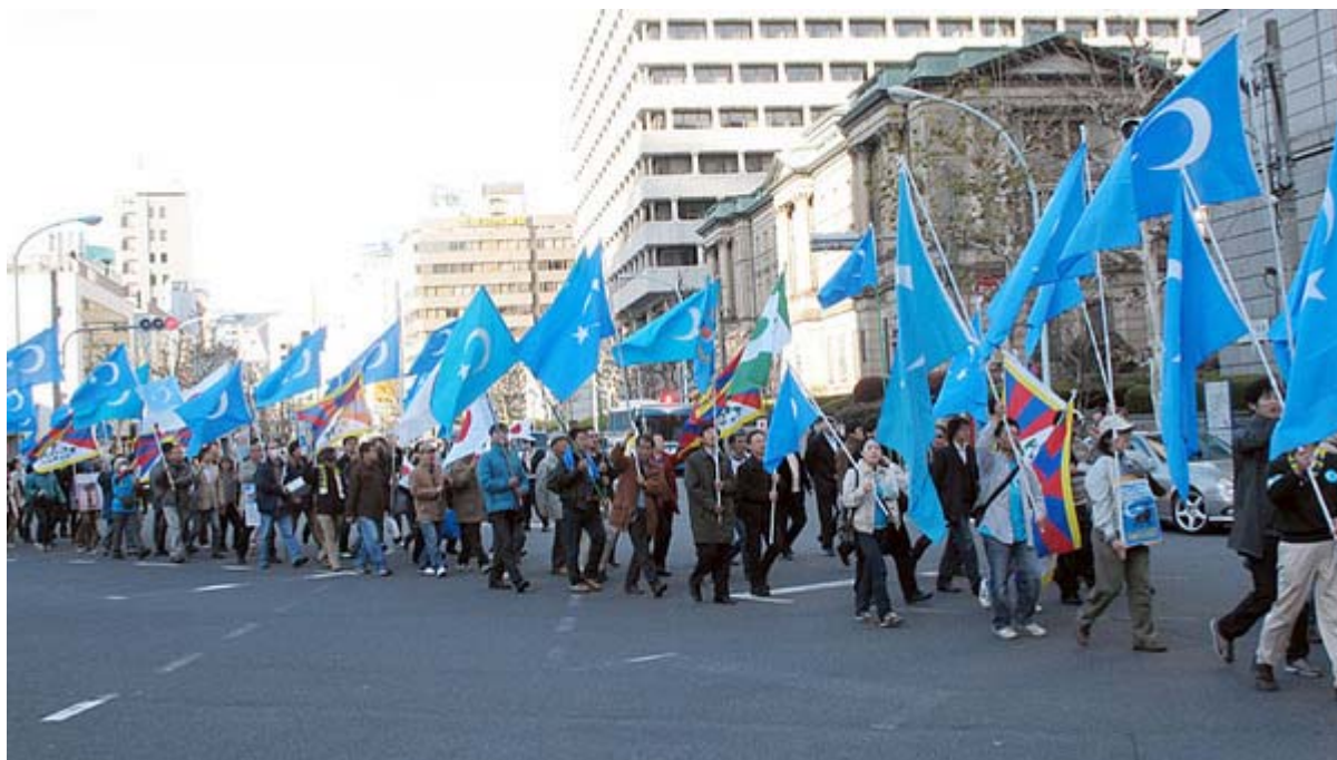
デモスタート直後の日銀前の一行。ブルーの国旗が美しいです。

来日する習近平・中国国家副主席に対する抗議デモが12日、常盤橋公園から外堀通り、日比谷公園にかけて行われ、約220人(公安調べ)が参加。一行は抗議のシュプレヒコールを叫び、道行く東京・銀座周辺の人々に訴えかけました。前日には習近平と天皇陛下との会見が慣例を無視して急遽決まったばかりであり、参加者はその怒りも含めて声高らかに叫び続けていました。