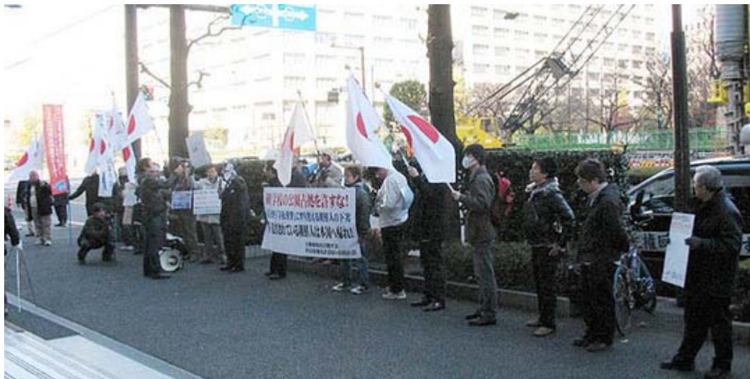
急の呼びかけで集まった行動する保守とその支援者の皆さん

ボール遊び禁止の児童公園に勝手にゴールポストを設置、素人仕事のデタラメな配線でいつ漏電してもおかしくない学校用のスピーカー設置、そして朝礼台設置とやりたい放題を続けてきた 朝鮮学校 に対し、両関西支部は共同で不法占拠物(または不法投棄のごみ)を撤去し持ち主の朝鮮学校へ届けたのです。