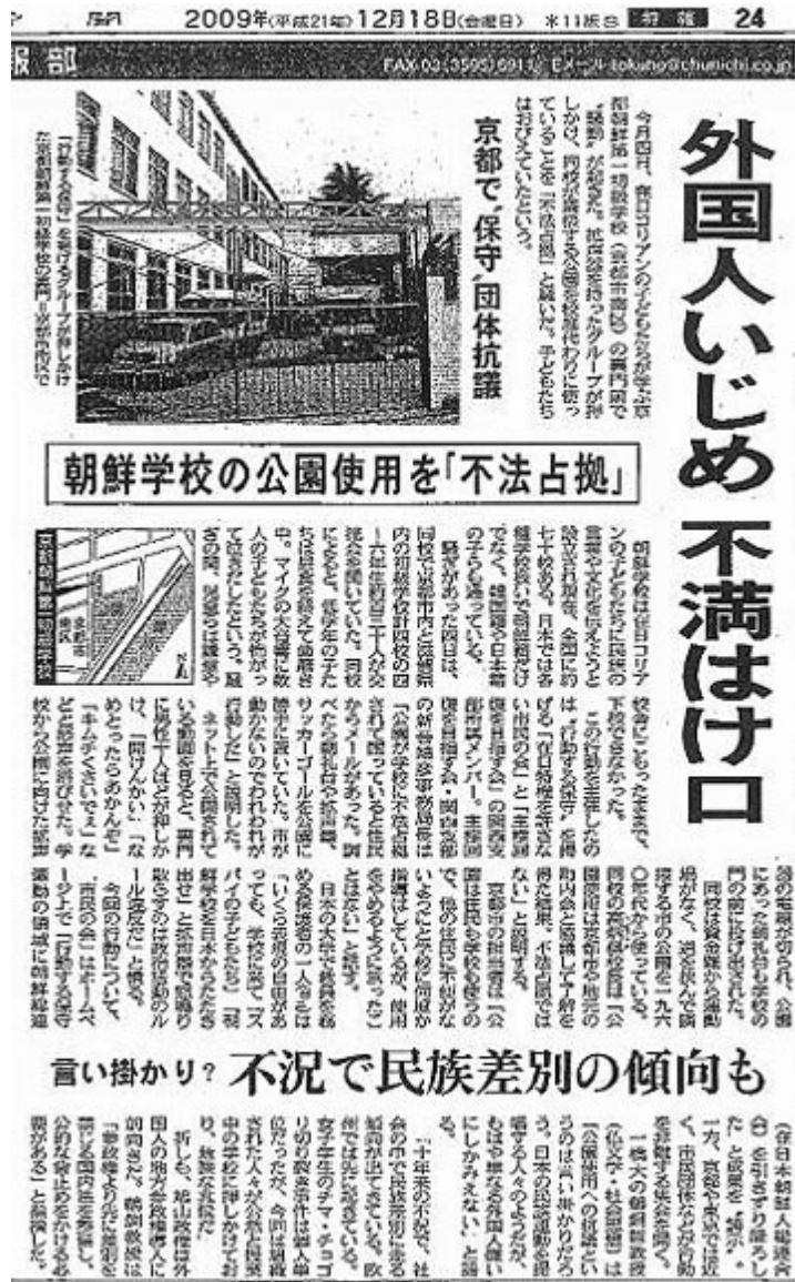
一方的に行動する保守を非難する内容の東京新聞18日朝刊の記事

●9・12・4朝鮮人違法占拠京都児童公園奪還 1/6 2/6 3/6 4/6 5/6 6/6