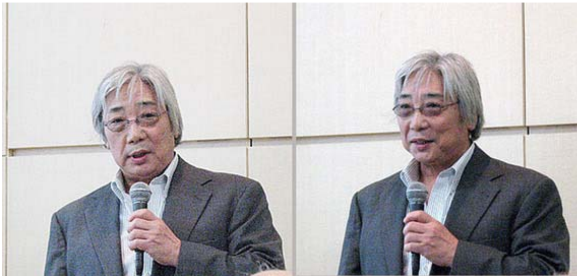
人気あるんですね～、面白いのですが活字にしにくい表現も多い講演でした。

また話が日露戦争でアメリカのルーズベルト大統領が講和に乗り出した背景に及び、「ルーズベルトには明確に日本を封じ込める狙いがあった」と語り、詳しくは「歴史通」に書いてあるから読んで下さい、と現物を見せて購入を催促されてしまいました。と言うわけで早速購入して「なるほど」と言う部分が以下です。何故か日本では「ルーズベルトに人気があるが、とんでもない」、その内容が判る記述に納得した次第です。