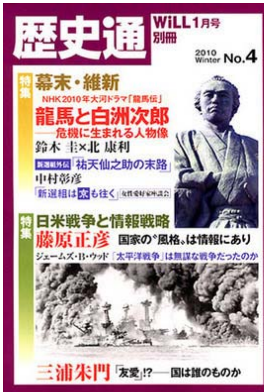
歴史通第四号は定価860円で好評発売中です。