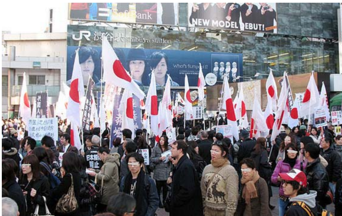
相変わらず渋谷は人出が多いですね。多数の日章旗もよく似合います。

外国人地方参政権 絶対阻止！街頭宣伝活動 /NHK「JAPANデビュー」に抗議する街頭宣伝活動が天長節の23日午後、渋谷ハチ公前とNHK前けやき通りで実施されました。祝日に渋谷に来た多くの人々に民主党権の危険性、外国人参政権の欺瞞をかなりアピールできたと思います。