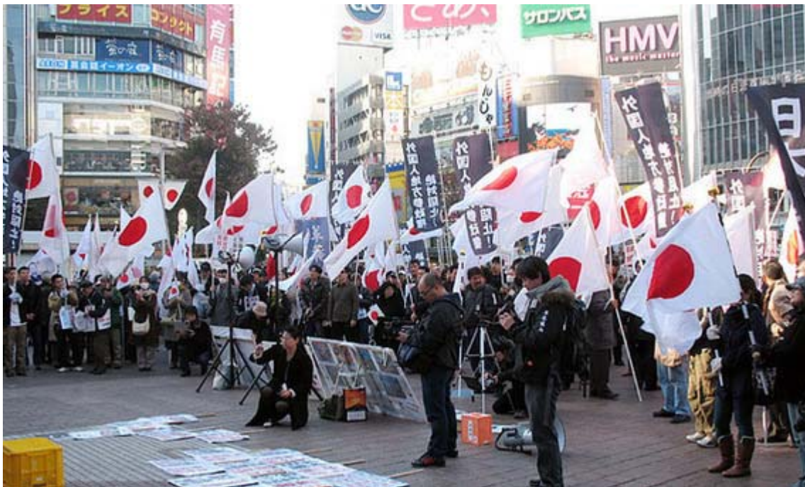
ハチ公前のこの光景、すっかりお馴染みになりました