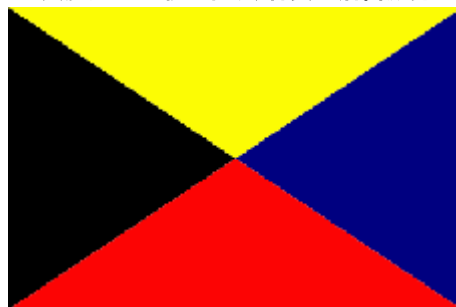
Z旗 『ウィキペディア(Wikipedia)』