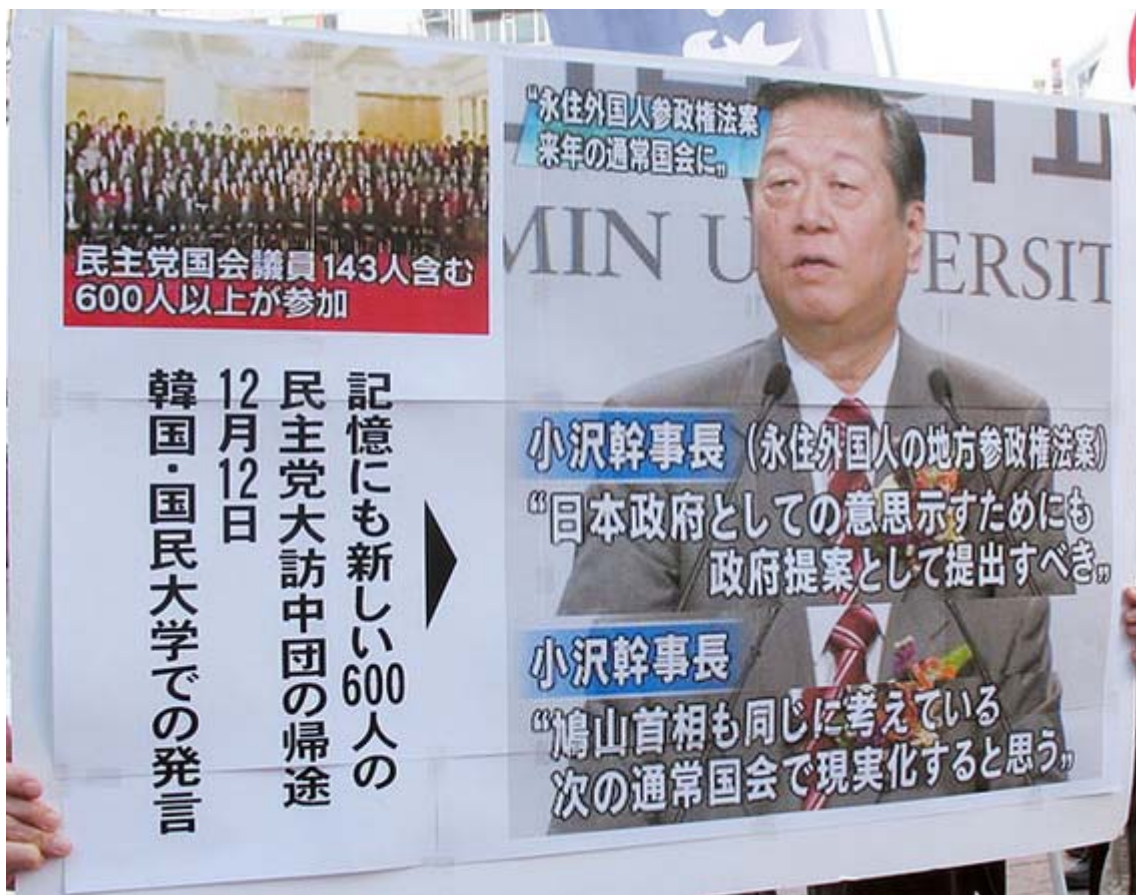
本日はいつもと趣向を変えて、主催者(草莽全国地方議員の会、外国人地方参政権絶対阻止行動委員会、日本文化チャンネル桜 二千人委員会有志の会、「NHK『JAPANデビュー』」を考える国民の会)が用意したプラカードの数々を紹介します。最新の情報をもとに上手く作るものですね。