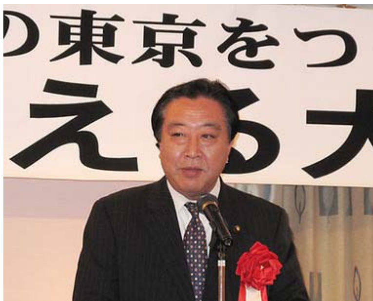
東京都議会議員吉田康一郎氏の出陣式で挨拶する野田佳彦衆議院議員