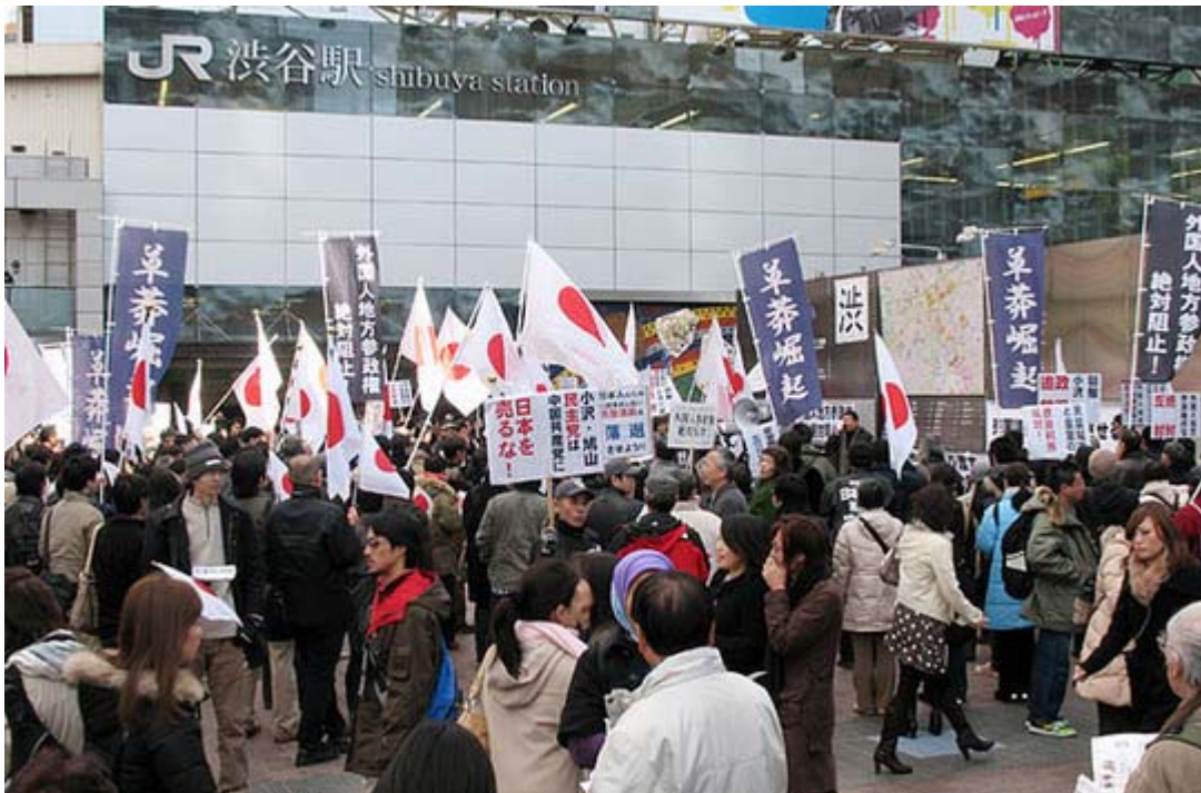
大晦日でも普段と遜色ない人が参加してくれました

さすがに大晦日では参加者は少ないだろうと思い、大掃除の合間を縫って出かけてみると、どうしてどうして、普段と遜色ない動員です。主催者の草莽全国地方議員の会・ 日本文化チャンネル桜 二千人委員会有志の会が着実に組織を固めつつあることが伺われました。