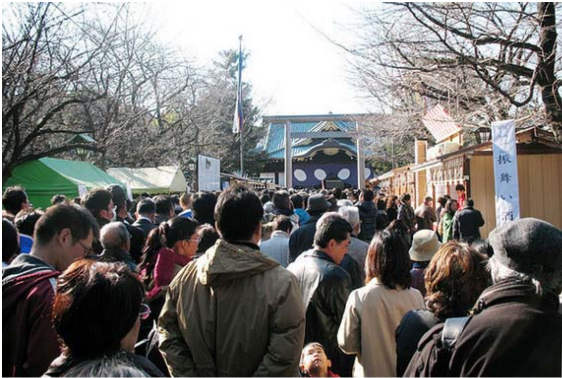
参拝には凄い行列で既にロープ規制が行われていました。

靖國神社も凄い混雑でした。境内には正月らしく出店がずらりでしたが、参拝の列が凄く、私は先に能楽堂のイベントや遊就館の「奉納 新春刀剣展」を見てから再び列に並んだのですが、どんどん列がのびて観念して並んだのでした。参拝者の数字はまだ把握していませんが、恐らく昨年よりも増えているのでしょうか？。