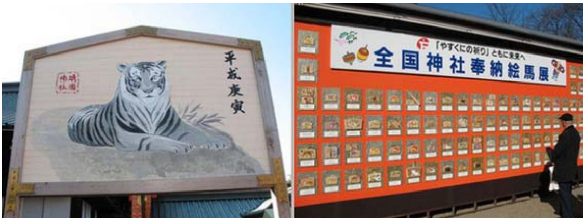
お正月はいろいろなイベントが開催されている靖國神社です。

靖國神社も凄い混雑でした。境内には正月らしく出店がずらりでしたが、参拝の列が凄く、私は先に能楽堂のイベントや遊就館の「奉納 新春刀剣展」を見てから再び列に並んだのですが、どんどん列がのびて観念して並んだのでした。参拝者の数字はまだ把握していませんが、恐らく昨年よりも増えているのでしょうか？。