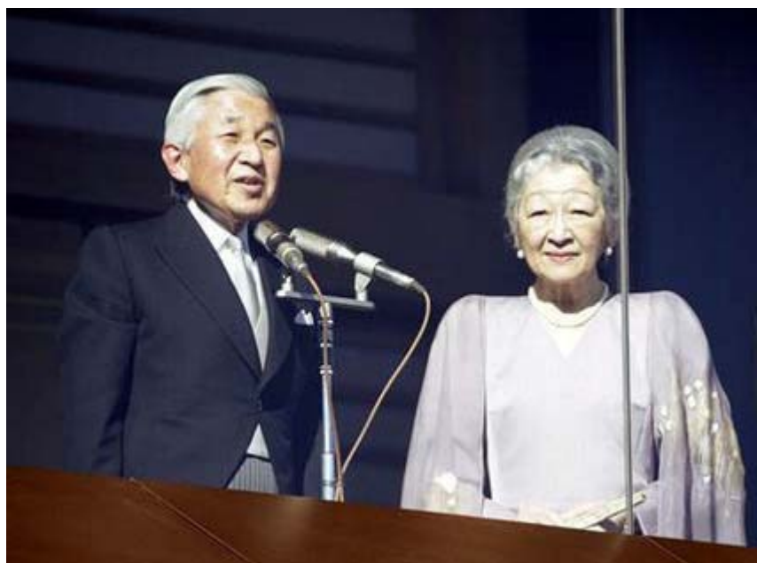
新年にあたってお言葉を述べられる天皇陛下。

二日は昨年同様に皇居に新年参賀に行き、そのあと靖國神社に参拝してきましたので、スナップ集をお届けします。電車の事故で皇居には予定より20分遅れて到着、これが致命傷で現地に入ることが出来たのは二回目の途中、肝心の陛下のお言葉が終わり、「天皇陛下 万歳！」が場内で叫ばれ、日の丸の小旗が一斉に触れている最中でした。