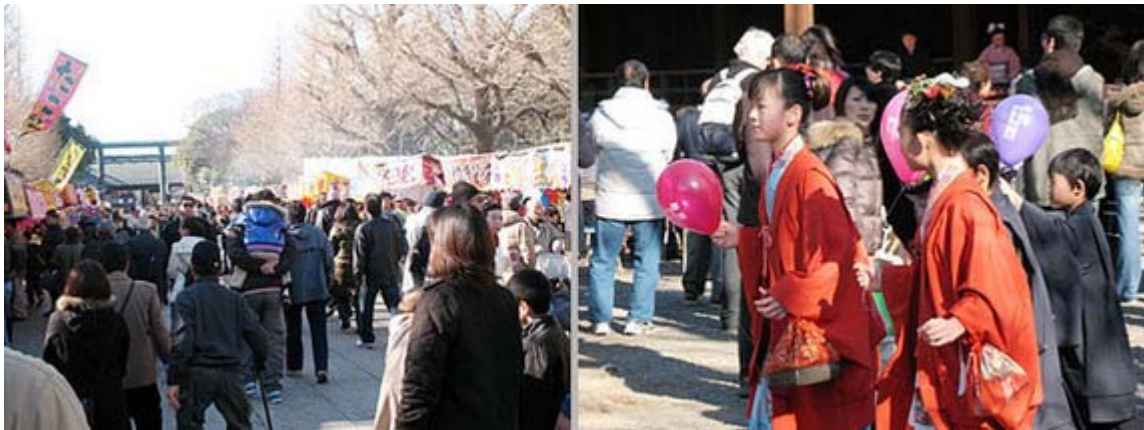
お正月らしい賑わいの境内。きもの姿の姉妹(?)を見つけました。

帰宅して報道をチェックすると、お出ましが七回から五回に少なくなったにもかかわらず、昨年より約3500人多い約7万9290人が一般参賀に訪れたとありましたので、やはり一回あたりの密度が上がっているのだと実感した次第です。これは嬉しい傾向です。