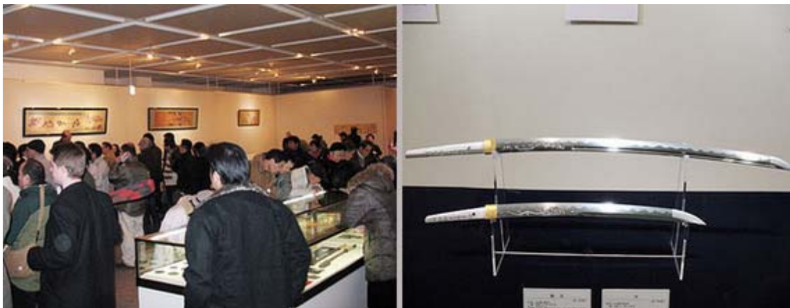
遊就館で行われている「奉納 新春刀剣展」のスナップです。 かなりの人が入って熱心に見つめていました。