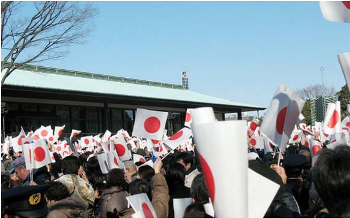
いつ見てもこの光景は素晴らしいです。 ボランティアでこの小旗を配布されている皆さんに感謝です。

帰宅して報道をチェックすると、お出ましが七回から五回に少なくなったにもかかわらず、昨年より約3500人多い約7万9290人が一般参賀に訪れたとありましたので、やはり一回あたりの密度が上がっているのだと実感した次第です。これは嬉しい傾向です。