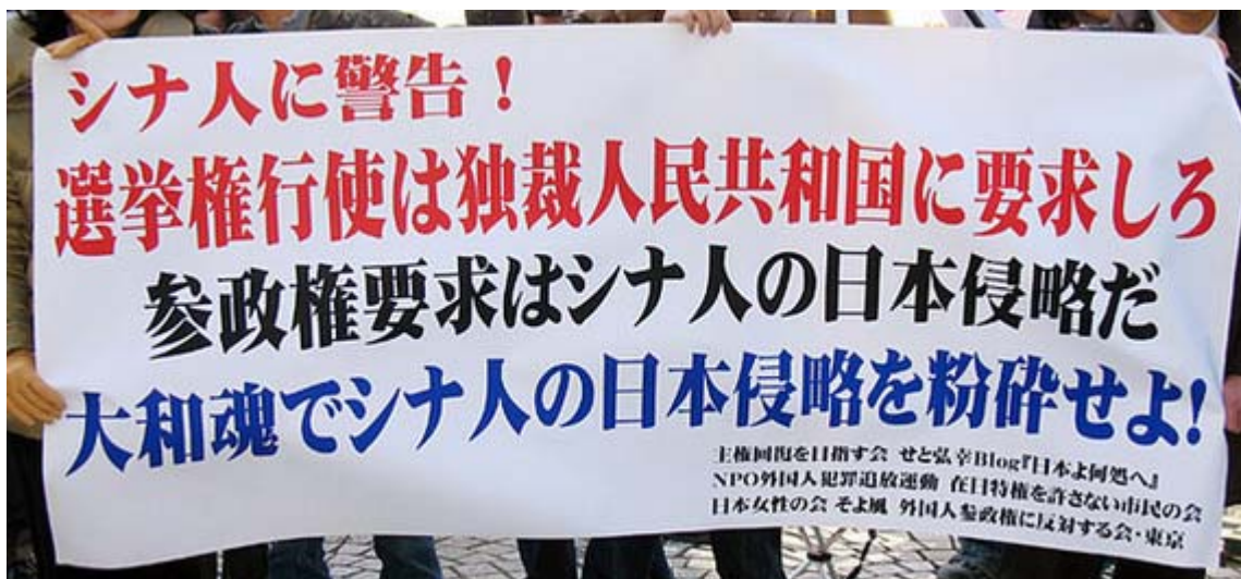
こちらは外国人地方参政権に関する横断幕です

据日本东京池袋警察署序・#35748, 大约100名日本人将于10日中午在东京池袋地区华人区举行示威游行活动。据当地华人介绍, 这将是右翼分子继去年9月26日骚扰池袋华人物产店之后第二次活动, 而且规模更大。