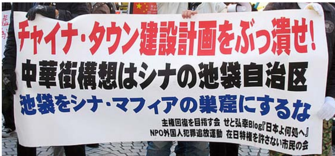
この横断幕は道行く人へのアピール効果は充分でした

私は次の予定があったため現地にいることができたのは街宣開始から40分ほどでしたが、抗議団が集結する前から多数の警察や公安の方がものものしい警備している姿が目につきました。肝心の陽光グループの商店は路上にはみ出した部分をなくして綺麗なものの。ただ普段は路上に商品を並べている痕跡が判るような片づけ方で、この日のためにわざわざ奥に引っ込めたという印象がありました。