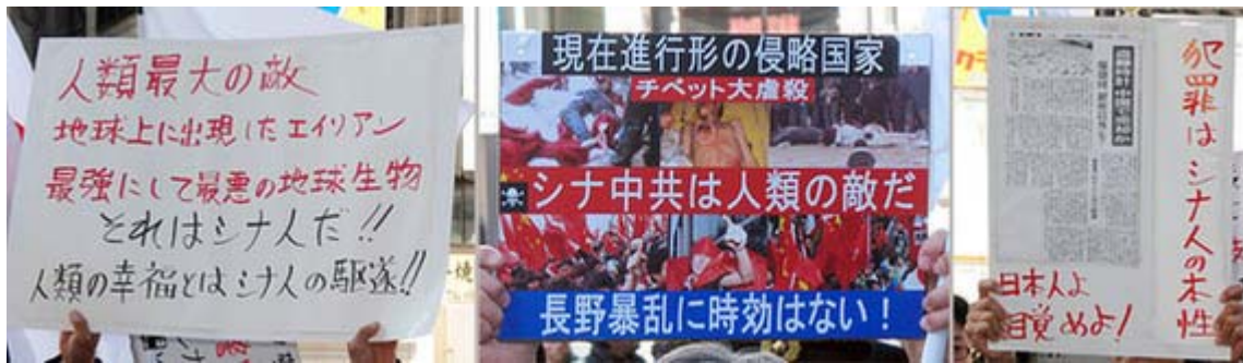
参加者が掲げていたプラカードのスナップです

法を破り、日本人を愚弄するシナ人を許すわけにはいかない。シナ人に警告するが我々日本人を嘗めるな！法を破る陽光グループの商店は破壊・たたき壊されたところで文句の言える筋合いではないのだ。