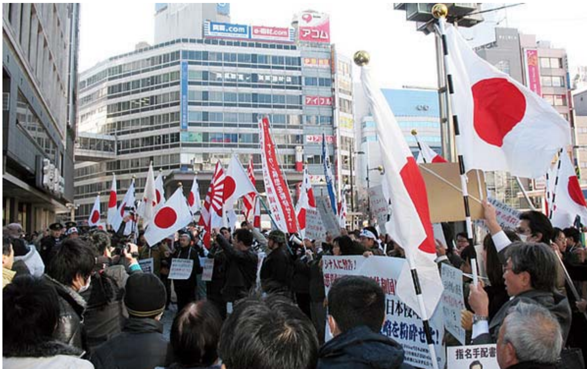
交番前で気合いの入ったシュプレヒコールをあげた抗議団のメンバー

私は次の予定があったため現地にいることができたのは街宣開始から40分ほどでしたが、抗議団が集結する前から多数の警察や公安の方がものものしい警備している姿が目につきました。肝心の陽光グループの商店は路上にはみ出した部分をなくして綺麗なものの。ただ普段は路上に商品を並べている痕跡が判るような片づけ方で、この日のためにわざわざ奥に引っ込めたという印象がありました。