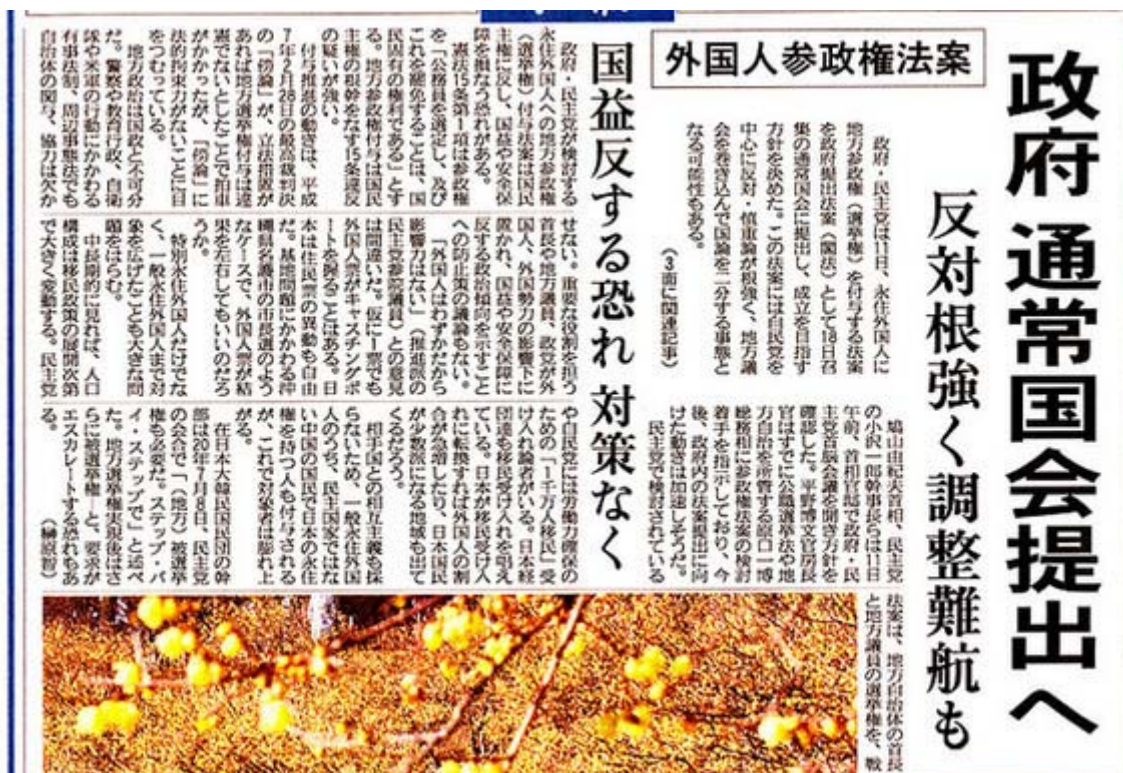
外国人参政権法案を通常国会提出を伝えた産経新聞1月12日朝刊一面トップ (画像クリックで記事に飛びます)

産経新聞のスキャン画像を掲載しました。いよいよ天下分け目の戦い、最終戦の幕が切って落とされました。これ以上はない反日・売国・亡国法案である「外国人地方参政権」の上程は本予算通過後の四月早々が予想されています。それまでに世論をどの程度喚起できるか、国会議員を動かせるか、これが勝負です。