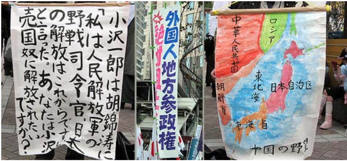
手書きの方が確かに訴える力がありますね。この日本地図をはじめて見る人も多いでしょう。

それを国会と言う場でやろうと言うのだ。国家の秩序が崩壊し、財政が破綻。日米関係も不安定。これが彼女が望む社会だ。加えて家庭が崩壊。少女売春がはびこり、教育は日教組のより更に荒廃。それを望んでいる。