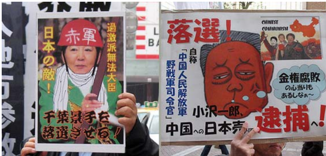
誰が考えてくれたのでしょうか？上手いものですね。訴求効果は抜群でしょう。