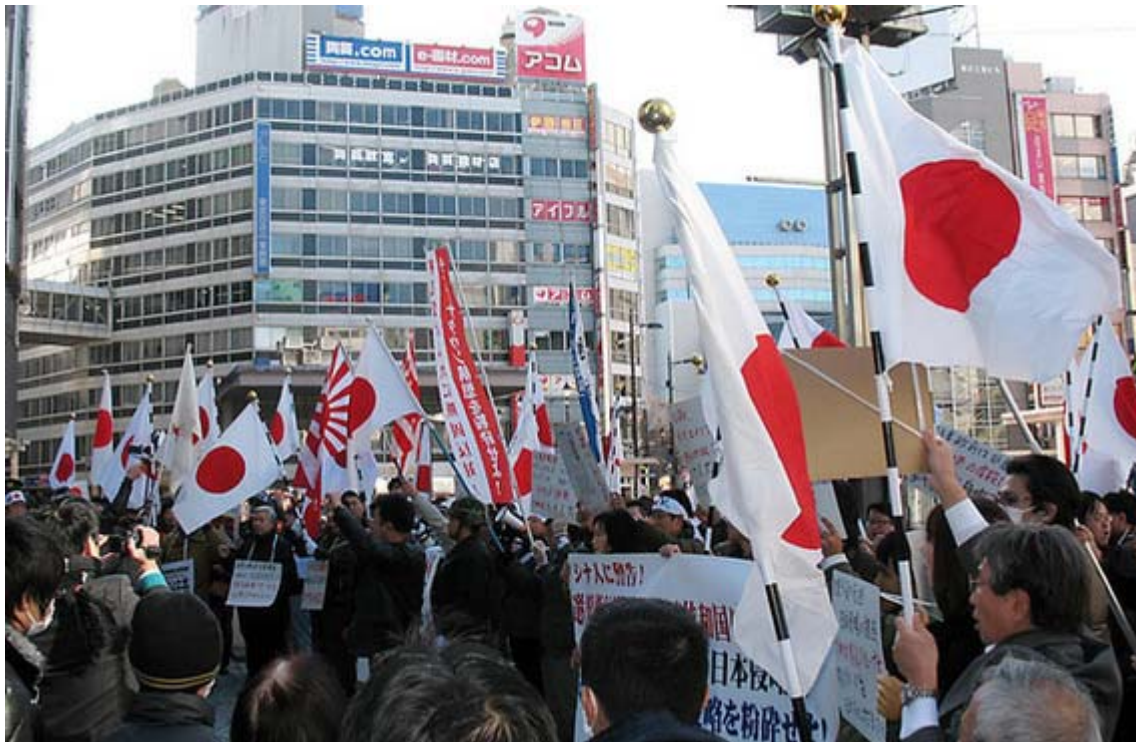
1.10池袋での中華街阻止抗議街宣からスナップです。