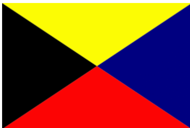
Z旗「皇国の興廃此の一戦に在り、各員一層奮励努力せよ」

当然ながら、この日はいわゆる街宣右翼もかなりの数で抗議行動するとされていますので、当日の日比谷公園周辺は、公園内はもちろん、周辺でもかなりの規制が敷かれます。一種「騒然とした雰囲気」になることはほぼ確実な情勢となりました。「日本解体阻止」前半戦のヤマ場となります。