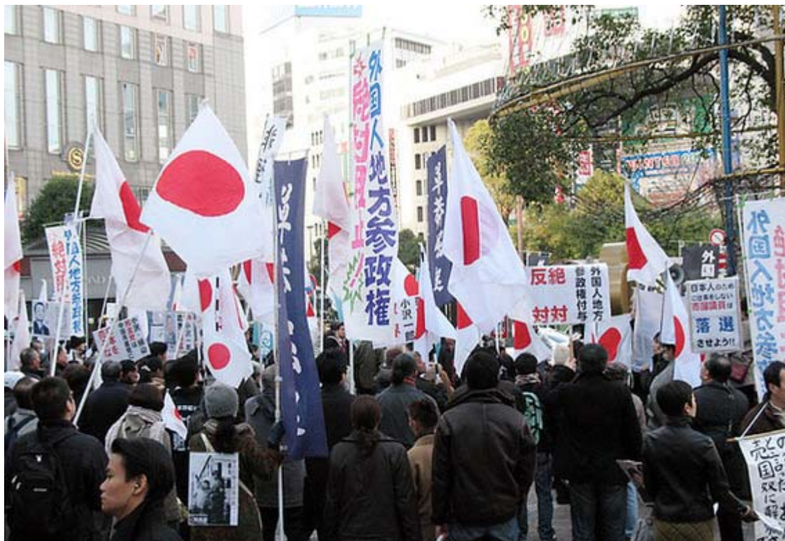
1.11横浜での抗議行動(高島屋まえ)からスナップです。

国憂う国会議員の諸君。頼まれなくても自ら出てきて「ひとこと話をさせて欲しい」くらいの意気込みを見せてみる！。それがかなわないなら、激励の電報を打つ、「花代」代わりの金一封届けるくらいのことをしても罰は当たらないぞ。誠意を見せろ！。「日本を守る正義の戦い」に諸君は出てこれないのか？。