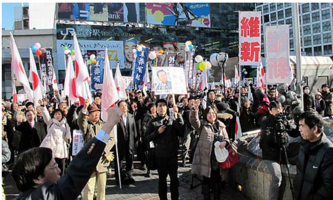
街宣の最後に「 民主党解体 」「 小沢逮捕 」のシュプレヒコール、気合いが入りました。

ホテルニューオータニで東京地検特捜部による注目の小沢幹事長の事情聴取が行われたタイミングに合わせるかのように、「1. 23 金権腐敗・小沢一郎は議員辞職せよ！外国人地方参政権阻止！緊急国民大行動」が急遽実施され、約600名を超える参加者が抗議の声とデモ行進を行いました。