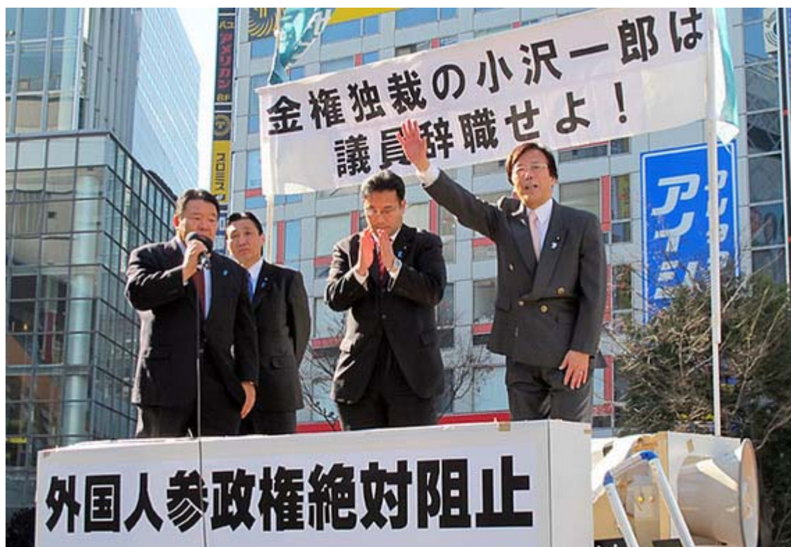
スピーチした三人の議員を改めて紹介。盛大な拍手が寄せられました。

この日の行動は、12時から渋谷駅ハチ公前広場で街頭宣伝活動、13時から代々木公園イベント広場で集会・デモ行進準備、14時からデモ行進出発(代々木公園イベント広場～渋谷駅方面～代々木公園イベント広場)、15時過ぎから再び渋谷駅ハチ公前広場で街頭宣伝活動とかなり忙しいスケジュールでした。