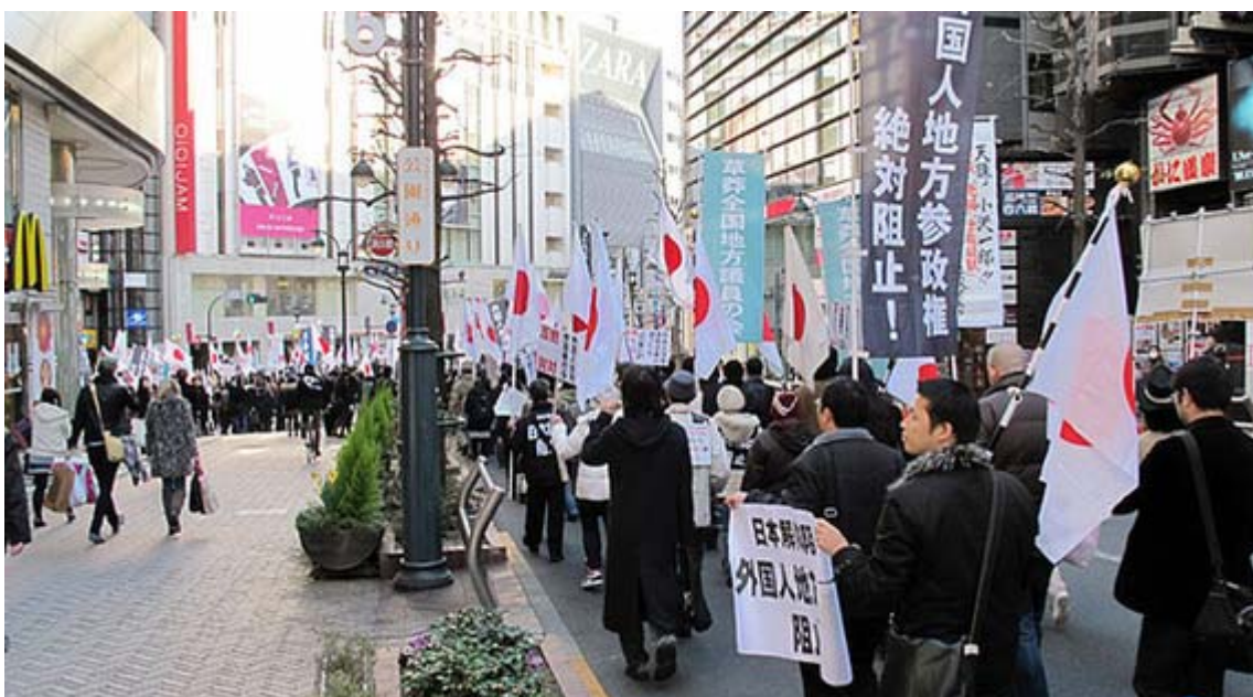
この付近が一番車との関係で渋滞しました。正面右がすぐ渋谷駅前になります。

時間がずれ込んだ事もあり、かなりあわただしくデモ行進が出發しましたが、撮影のために別行動を取っていると、デモの趣旨を理解している通行人がかなり増えているという印象です。また、デモ参加者の様子も、昨年5-6月頃と比較すると、道行く人に向かって声を張り上げる人が大幅に増え、シュプレヒコールも一段と声が大きくなって、アピール効果は格段に上がっていると感じました。