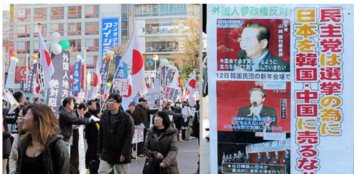
ずらりと勢揃いして道行く人にビラを配りました、これは新しいプラカードでしょう。

この日の行動は、12時から渋谷駅ハチ公前広場で街頭宣伝活動、13時から代々木公園イベント広場で集会・デモ行進準備、14時からデモ行進出発(代々木公園イベント広場～渋谷駅方面～代々木公園イベント広場)、15時過ぎから再び渋谷駅ハチ公前広場で街頭宣伝活動とかなり忙しいスケジュールでした。