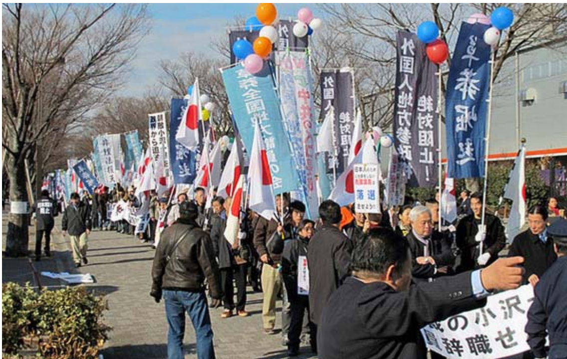
NHK放送センター前に勢揃いしたデモ隊。日の丸よりも幟の方が多くいらいですね。

時間がずれ込んだ事もあり、かなりあわただしくデモ行進が出發しましたが、撮影のために別行動を取っていると、デモの趣旨を理解している通行人がかなり増えているという印象です。また、デモ参加者の様子も、昨年5-6月頃と比較すると、道行く人に向かって声を張り上げる人が大幅に増え、シュプレヒコールも一段と声が大きくなって、アピール効果は格段に上がっていると感じました。