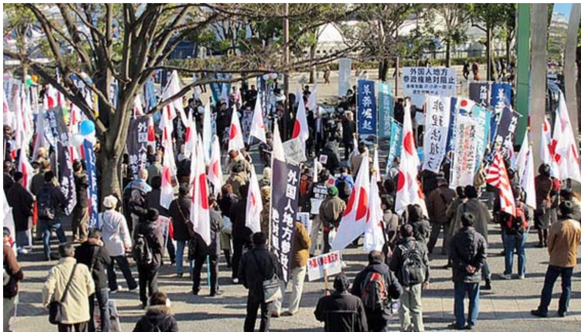
代々木公園の集会の全景、階段上から撮影しました。

12時からじまったハチ公前街宣では、土屋たかゆき、こいそ明両都議会議員、港区の山本へるみ区議会議員、国際ジャーナリストの藤井厳喜氏らが登壇、それぞれの立場から 民主党 政権の欺瞞、外国人参政権の危険性を訴えました。まわりを見渡してみると、待ち合わせている人も含めてかなり熱心に聞く人が非常に増えたという印象です。