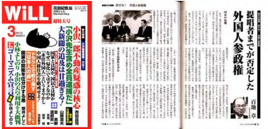
WILL3月号は定価780円(税込み)で好評発売中です(画像クリックでHPIにジャンプします)

外国人参政権の持つ意味は、「国家とは何か」という原点から考えないことには、問題の本質がわからないため、日常的にはその重大性や深刻さが理解し難い。しかしその分、いざという時になれば、重大な問題が発生する危険性を孕んでいる。