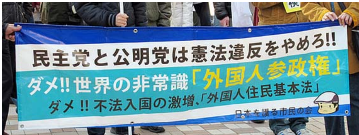
「世界の非常識」というタイトルが良い日護会の横断幕

これは日本を護る市民の会が主催し、在日特権を許さない市民の会、そよ風が協賛して実施されたデモ行進で、約100人が駆けつけました。呼びかけ文にもありますが、小沢疑惑追求に向けての熾烈な戦いを行っている東京地検を全力で応援する、というのが良いですね