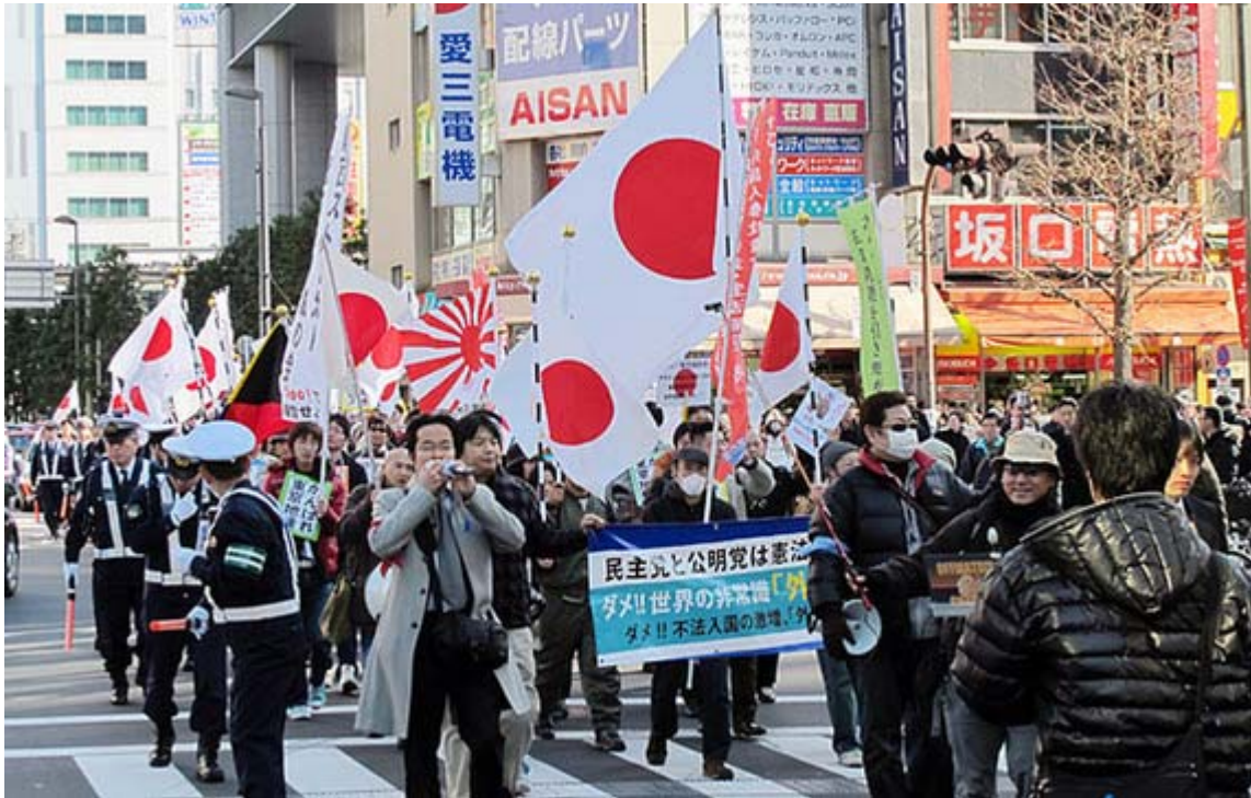
この中央通り交差点付近が買い物客も多く、一番盛り上がりました。

『朝敵、小沢一郎 刑事告発記念！国賊粉碎カーニバル in 秋葉原』という刺激的なネーミングのデモ行進が30日、大勢の買い物客で賑わう秋葉原一帯で行われ、「小沢一郎を許すな！」、「東京地検頑張れ！」とシュプレヒコールをあげ道行く人に訴えました。