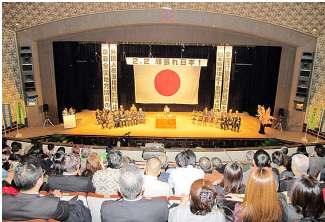
日比谷公会堂の二階席から撮影するとこんな雰囲気に見えます

2. 2 「頑張れ日本！全国行動委員会」結成大会並びに日本解体阻止！外国人地方参政権阻止！全国総決起集会が二日、日比谷公会堂に定員を上回る延べ2600人(主催者発表)の参加者を集めて盛大に開催され、日本の混迷した政治を打破するため、保守勢力をまとめ結集し、新たに擁立し、支援し育てることを決めた。