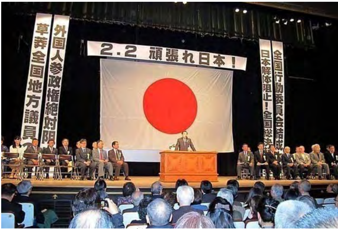
私が座ったポジションから撮影したステージの全景。 カメラの広角側(28ミリ)で撮影しているので歪曲してます。