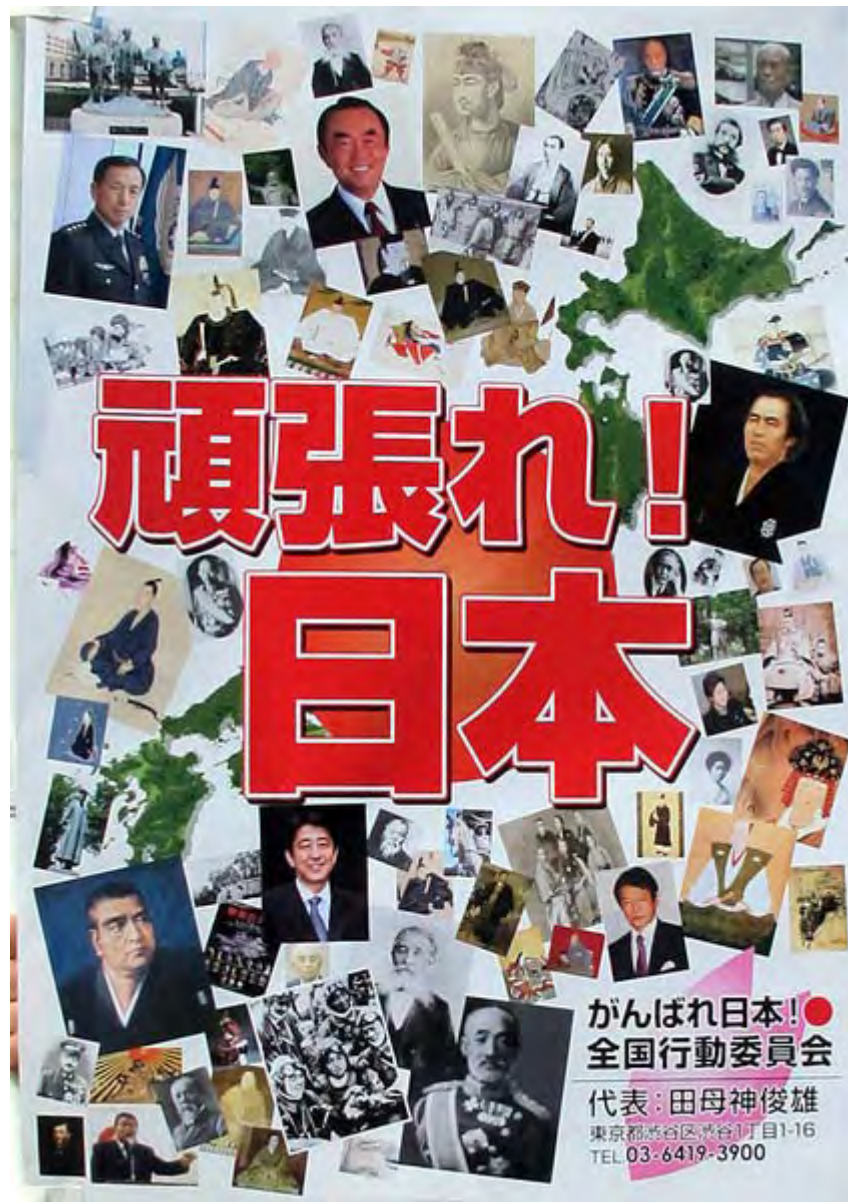
凄いポスターを作ってくれました。 ここに登場する人物が判れば貴方は立派な日本史の歴史通かも。

同じ、「外国人地方参政権反対」「日本解体に繋がる反日法案阻止」「 民主党 政権打倒」を掲げる組織・団体が何故協力できないのか。ここに保守勢力弱体化の根っ子を見る思いがします。少なくとも、上記三つの目標が達成できるまで「日本国体護持」の大義名分の前に協力すべきでしょう。自ら「保守」を名乗り、しかし同じ保守系団体を誹謗中傷する輩は、ここに至っては売国左翼と同じ事をしていることに気がつくべきです。