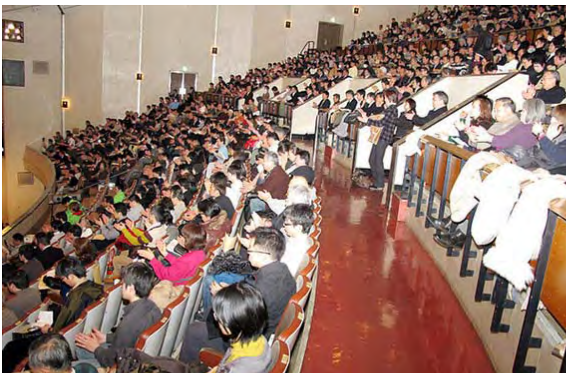
二階三階もご覧の通りの超満員、座りきれない人が立ち見していました。

世界最古の国日本の伝統文化を尊重し、それを築いて来た祖先への責任と、これから生まれ育っていく子孫たちへの責任を、担おうと決意したのである。