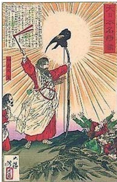
月岡芳年「大日本名将鑑」より「神武天皇」。 明治時代初期の版画。