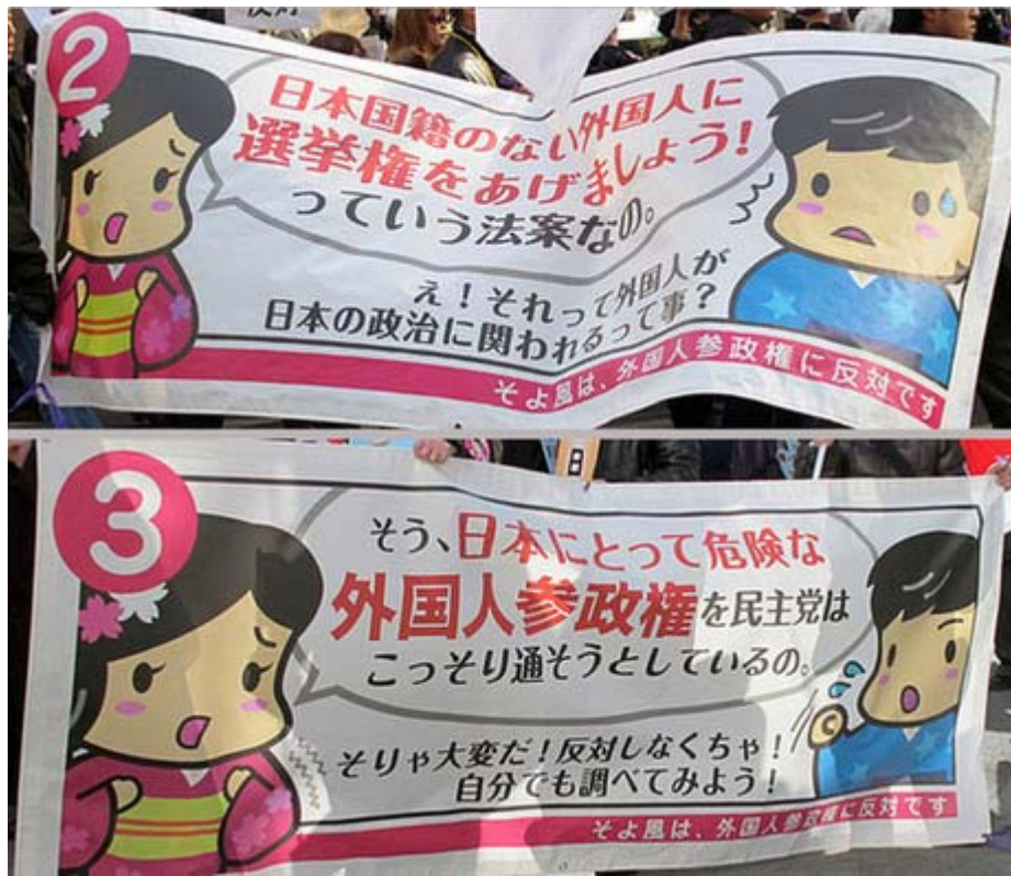
一番上の写真と加えて三連の横断幕。数ある団体の中でも一番立派では？。「そよちゃん」「太郎君」のキャラクターが可愛いです。

新宿の皆様、お騒がせしております。私達は、主婦やOL、学生など、ごく普通の生活をしていて、ごく普通に日本を愛する女性によって出来た会、そよ風でございます。 民主党政権 になって外国人地方参政権など日本解体法案が今国会で成立されそうな事に危機感を抱いて反対のデモを行っております。