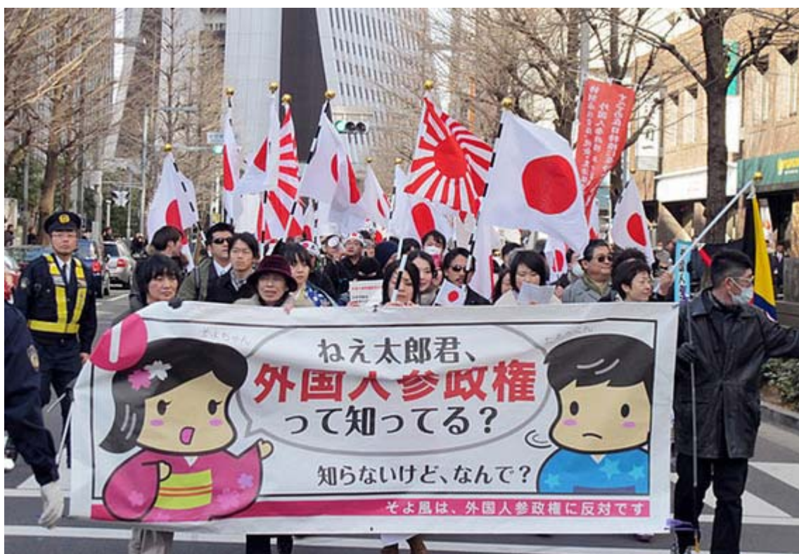
先頭の横断幕を女性が持つ、そよ風ならではのデモ行進の光景です

デモのコースは、柏木公園→靖国通り→歩道橋下→工学院大前→甲州街道→新宿駅南口→明治通り→伊勢丹前→職安通り(朝鮮人の巣窟)→大久保公園(解散)。やはり一番人が多かったのは駅南口と伊勢丹前。マイクで訴えるのが女性の声、可愛い横断幕に日章旗の数々という組み合わせに注目度と反応は抜群だった(ニュース調こまで)。