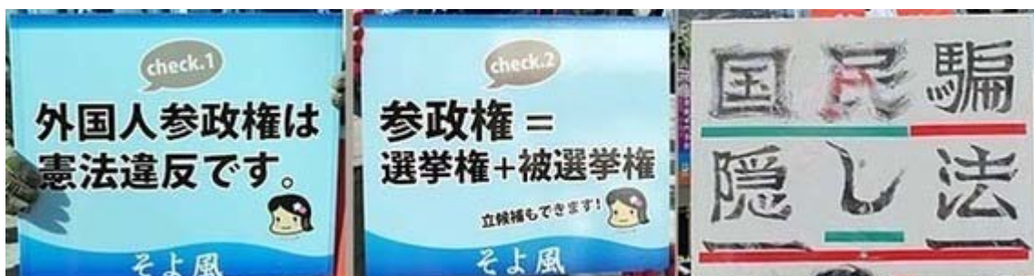
シンプルで判りやすいそよ風のプラカード。手書き文字は迫力が出ますね。

脱税総理、 鳩山由紀夫 は議員を辞職しろ！ 無能・無策の鳩山内閣は全員、辞職しろ！ 宇宙 人鳩山夫妻は 金星 に移住しろ！