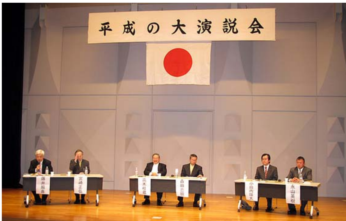
シンポジウムが行われたステージの全景です

この本については昨年11月5日のエントリー「シナ人とは何か－内田良平の『支那観』を読む」でとりあげています。平気でウソをつくシナ人、対中で被害は「中国人の国民性」と日本人の中国観とのギャップが原因、と見出しを付けましたが、シンポジウムの内容もこれと全く同じ。ひと言で言えば「無類のしたたかさをを持った民族」だが、「平気で嘘をつく」、「信用できない民族」それが支那人というのが「結論」になると思います。